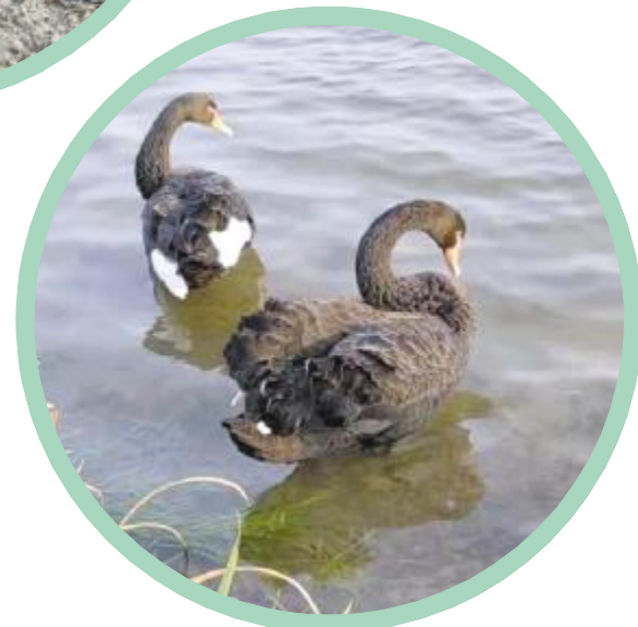
黑色精灵