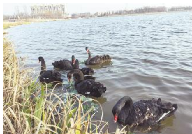
湖中仙子