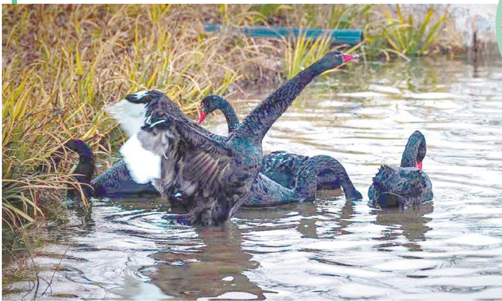
曲项向天歌