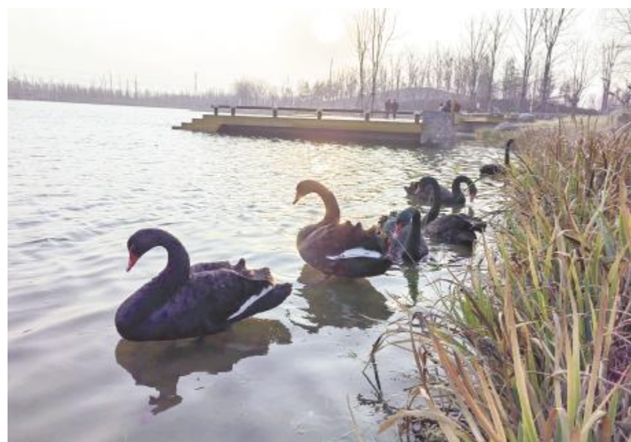
湖光倩影