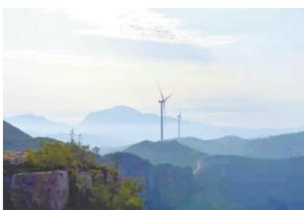
水墨晨曦