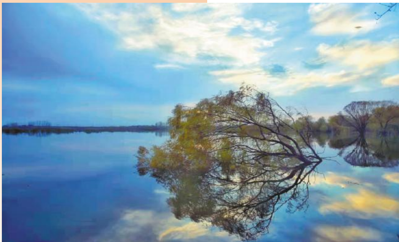
美丽的大张水库