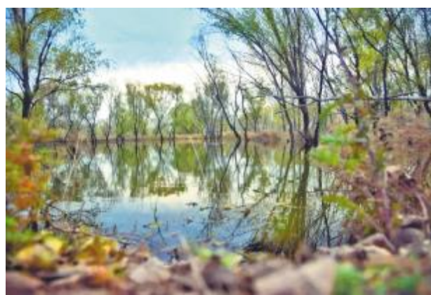
湖中秋色