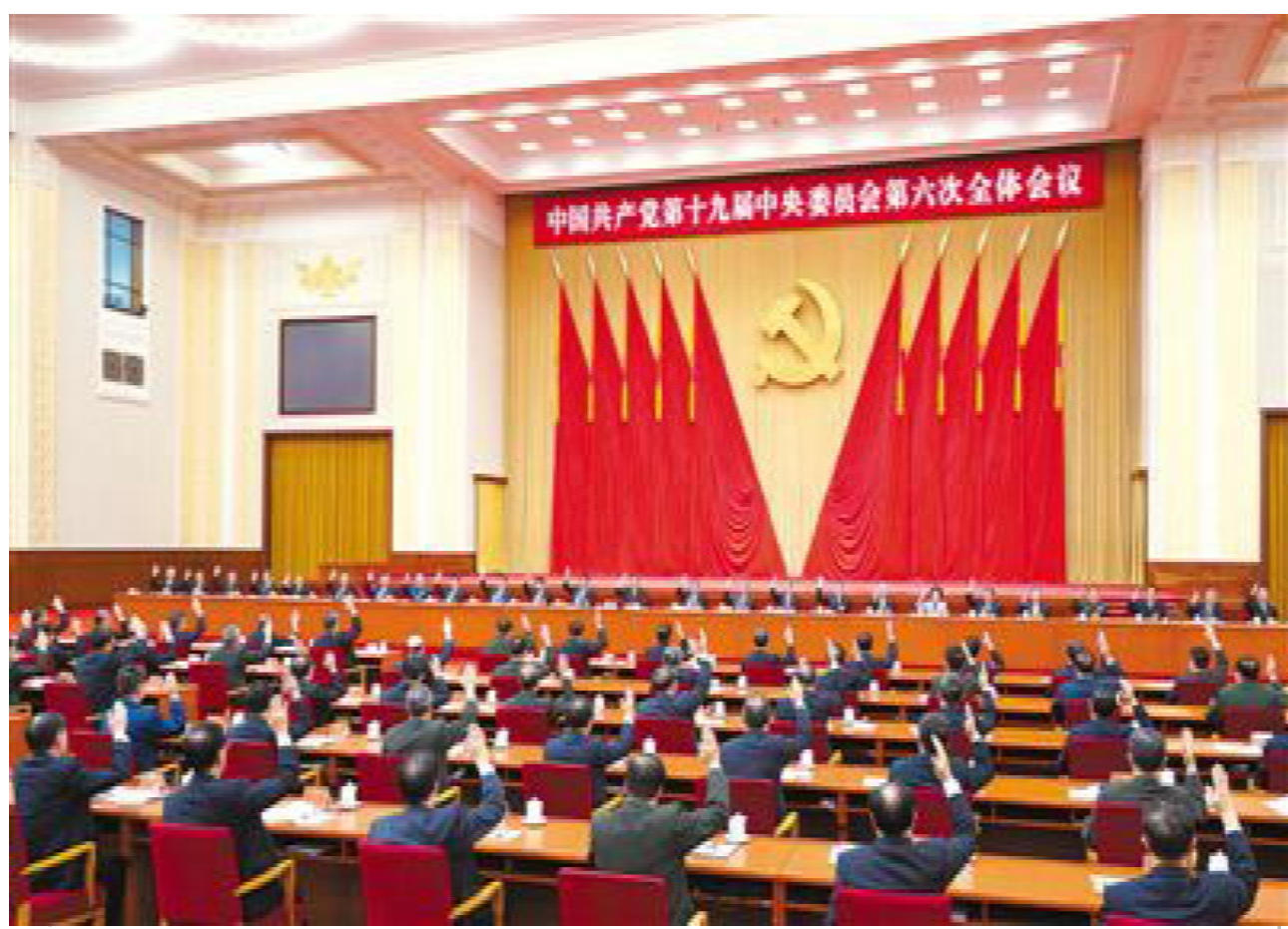
中国共产党第十九届中央委员会第六次全体会议，于2021年11月8日至11日在北京举行。中央政治局主持会议。