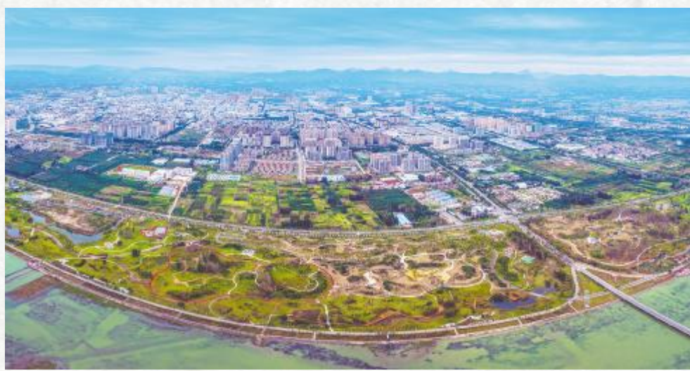
美丽汝州

苏轼曾三次到汝州,在他的《温泉七记》中,记录了汝州温泉的盛况;在游龙兴寺后,写的