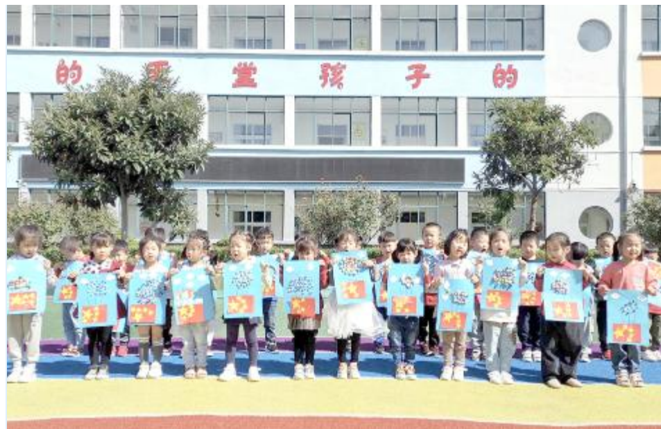
近日，钟楼镇中心幼儿园组织开展以“喜迎国庆 共唱繁荣”为主题的国庆节活动，通过共唱一首歌、制作手工等方式让幼儿体会到幸福生活的来之不易，萌生民族自豪感和对祖国的热爱之情。

刚鑫雨 ●为确保节日期间客运安全稳定，近日，市汽车客运有限公司召开安全生产工作会，对节日期间客运安全、疫情防控工作进行具体部署。组织安全科室