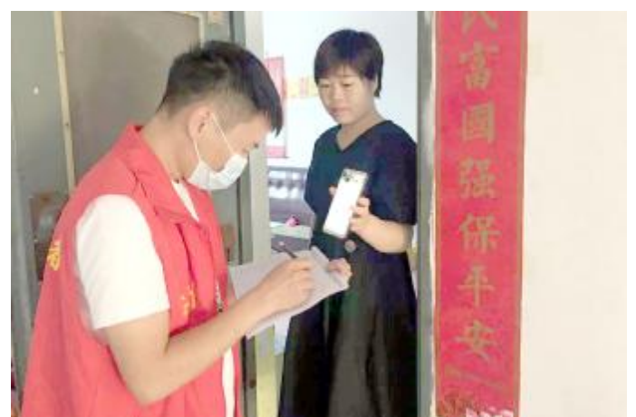
入户排查新冠疫苗接种情况

本报讯（融媒体中心通讯员 相晨然）8月25日，汝州市科协全体干部职工深入社区一线，对分包的无主小区——煤山街道富民五街44号小区居民开展“敲门”行动，全力做好新冠疫苗接种、近期旅居史入户排查登记工作。