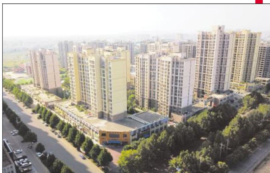
南关棚改项目——南关花园

五年辛勤耕耘,五年砥砺前行。市第七次党代会以来的五年,是我市应对重大挑战、经受重大考验、实现加速发展的五年。五年来,汝州市抢抓重大发展机遇,攻坚克难,开拓创新,走出了一条跨越式发展之路。