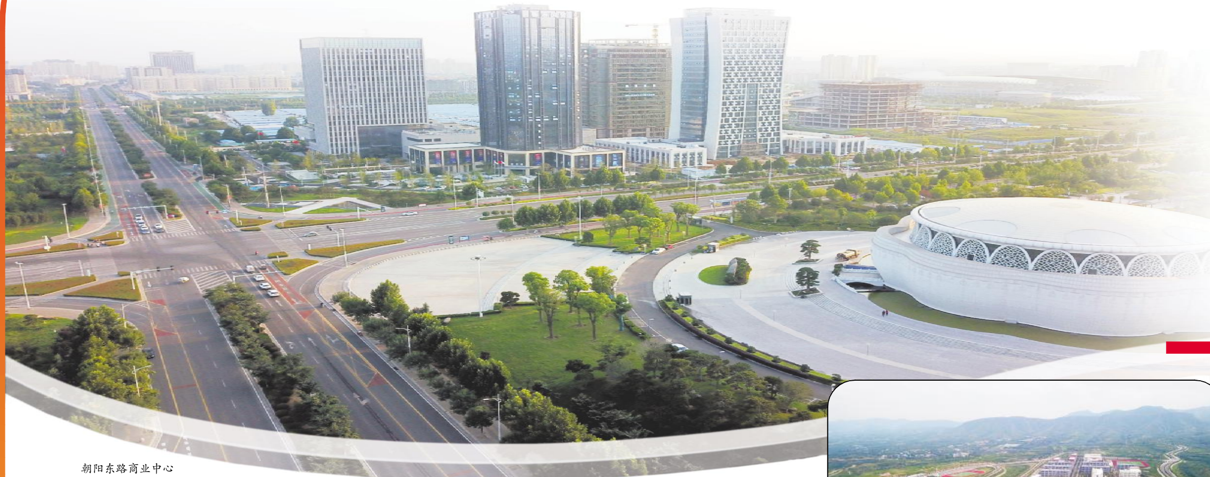
朝阳东路商业中心