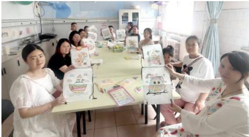
7月30日，市妇幼保健院孕妇产学校精心为在校优秀准妈妈“毕业生”们举办了“幸福有你”毕业典礼。图为准妈妈们在展示亲手制作的彩绘妈咪包。

我市粮油副食品价格运行平稳 本报讯（融媒体中心记者 李晓伟 通讯员 赵延峰）记者从市物价办获悉，据该办价格监测人员7月24日至30日对我市市场粮油副食品价格监测情况显示，近期，我市粮油副食品价格运行平稳，猪肉价格下降，蔬菜、鸡蛋价格略有上涨。成品粮价格基本平稳。东北大米平均价格为2.41元（500克，下同），与上周基本持平，与上月同期基本持平；小麦平均价格1.26元，较上周下降0.79%，较上月同期下降0.79%；玉米平均价格1.38元，较上周下降1.43%，较上月同期下降2.81%。 食用油价格基本平稳。金龙鱼一级5升桶装花生油平均价格为119.9元/桶，与上周基本持平，与上月同期基本持平；金龙鱼一级5升桶装菜籽油平均价格为75.68元/桶，与上周基本持平，与上月同期基本持平；金龙鱼一级5升桶装大豆油平均价格为52.90元/桶，与上周基本持平，与上月同期基本持平；金龙鱼一级5升桶装食用调和油平均价格为69.90元/桶，与上周基本持平，与上月同期基本持平。 猪肉价格略降。仔猪平均价格为16.00元，较上周下降3.61%，较上月同期下降3.61%；生猪收购平均价格为7.70元，较上周下降4.94%，较上月同期下降6.1%；五花肉平均价格为12.00元，较上周下降7.69%，与上月同期基本持平；精瘦肉平均价格为12.00元，较上周下降7.69%，与上月同期基本持平；牛肉平均价格为38.00元，与上周基本持平，与上月同期基本持平；羊肉平均价格为40.00元，与上周基本持平，与上月同期基本持平。 鸡蛋价格上涨。钟楼农贸市场鸡蛋平均价格为5.00元，较上周上涨1.628%，较上月同期上涨1.628%；从所监测超市情况看，7月30日鸡蛋最高价为5.08元，最低价格为4.98元。 蔬菜价格上涨。从钟楼农贸市场情况来看，监测26个蔬菜品种平均零售价格为1.94元，较上周上涨4.87%，较上月同期上涨10.86%。从具体情况看，26个蔬菜品种价格为5涨16平5降，芹菜、黄瓜、大白菜、生菜、洋葱价格上涨，菠菜、土豆、绿豆芽、黄豆芽、茄子、西红柿、大葱、香菇、平菇、蒜薹、大蒜、生姜、包菜、上海青、白萝卜、豆腐价格持平，青椒、韭菜、长豆角、冬瓜、胡萝卜价格下降。 从所监测超市情况来看，监测26个蔬菜品种平均零售价格为2.82元，较上周上涨4.44%，较上月同期上涨26.46%。从具体情况看，26个蔬菜品种价格为12涨4平10降，茄子、芹菜、土豆、长豆角、大白菜、包菜、洋葱、黄瓜、上海青、蒜薹、香菇、平菇价格上涨，菠菜、绿豆芽、黄豆芽、豆腐价格持平，大蒜、生菜、胡萝卜、生姜、大葱、韭菜、冬瓜、青椒、白萝卜、西红柿价格下降。