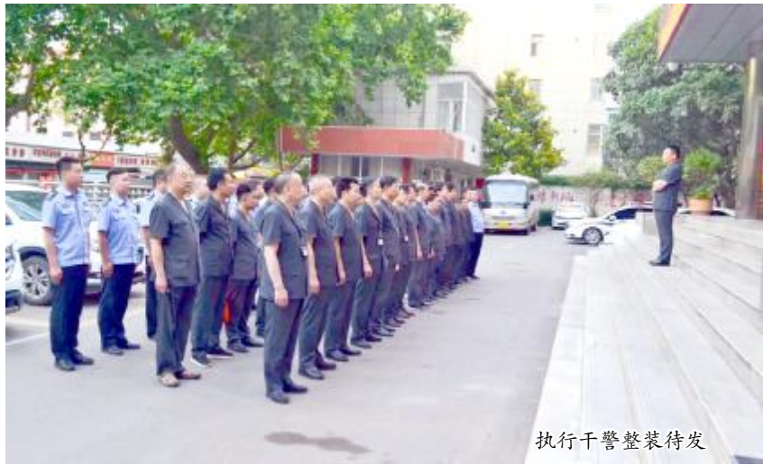
执行干警整装待发

为推动队伍教育整顿工作走深走实，做好“六稳”工作落实“六保”任务，切实把司法为民理念落实到具体行动中，近日凌晨5时30分，汝州法院70余名执行干警集结完毕，整装待发，在班子成员的带领下兵分6组，再次奔赴各个乡镇、街道，持续开展“百日雷霆”执行行动。