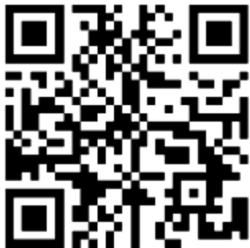
扫描二维码收听找党的革命故事