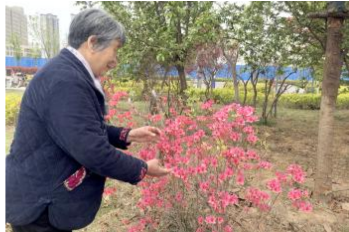
近日，市民在杜鹃园内赏花，红艳艳的映山红将人也映衬得格外喜庆。