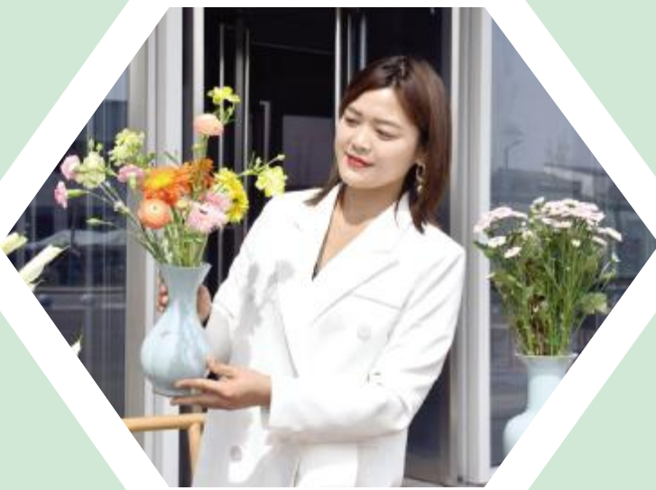
瓷器与花艺相结合