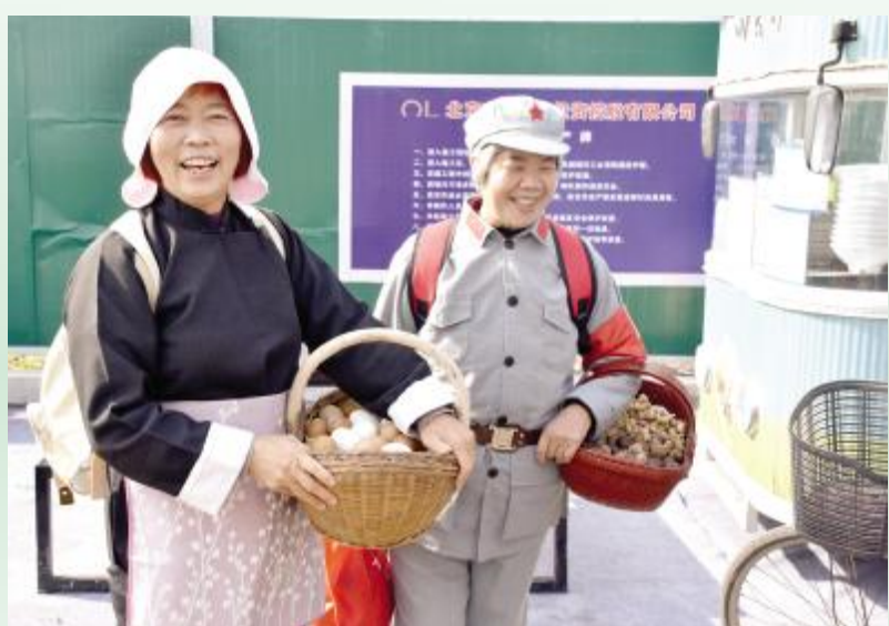
文艺志愿者等待上台表演

4月6日，春阳煦暖，和风轻拂，我市“恋瓷集”春季旅游文化活动在汝瓷小镇启幕。玉松汝瓷、文立窑、延杯窑等百余家汝瓷行业翘楚参展，省内外3000余人共同参与，见证了这一盛会。