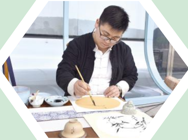
茶席大赛参赛者现场设计