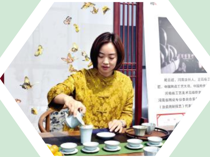
茶席大赛参赛者展示