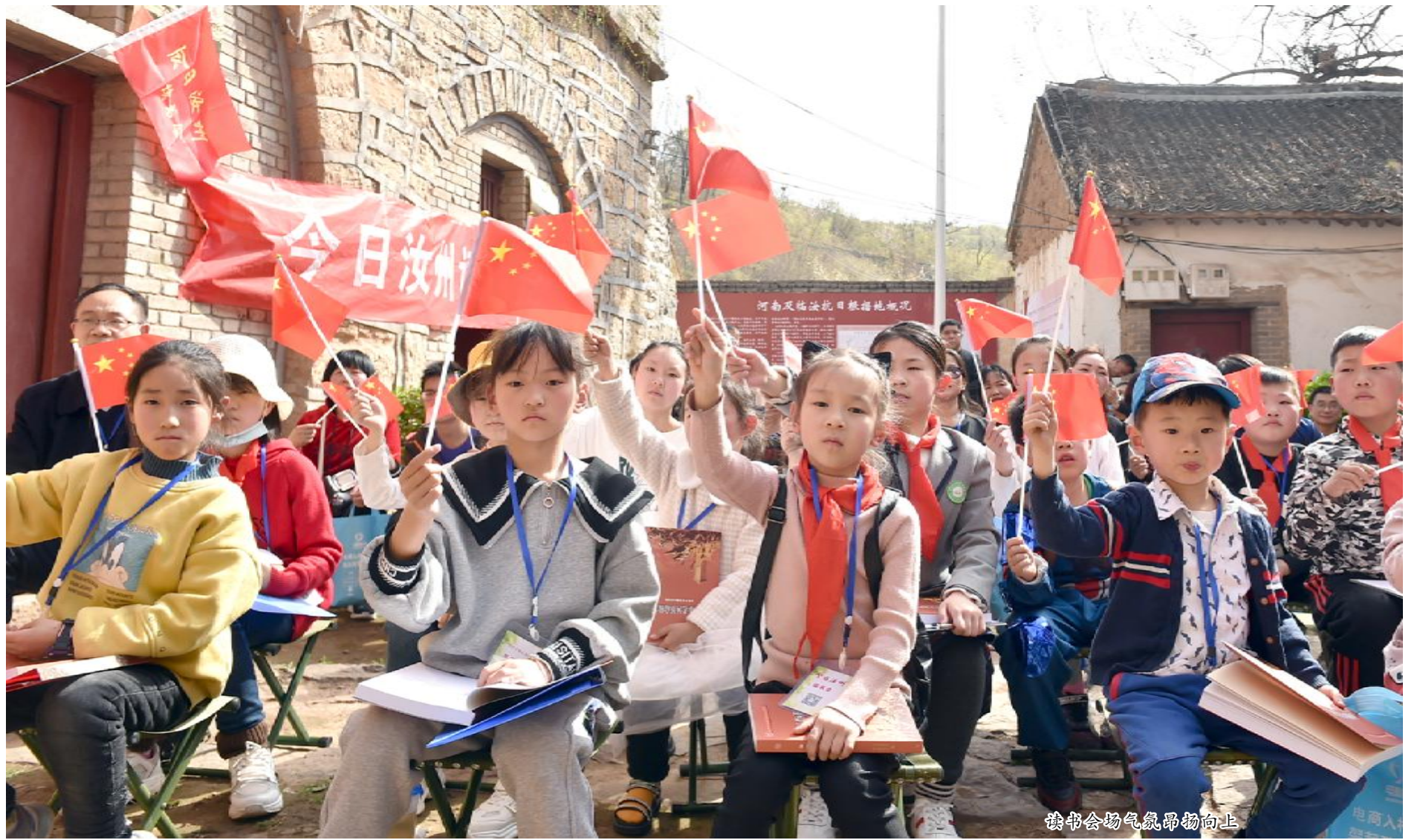
读书会场气氛昂扬向上