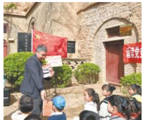
赠送党史学习辅助教材