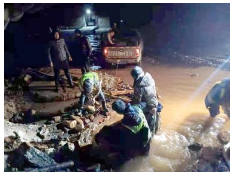
图 片 新 闻