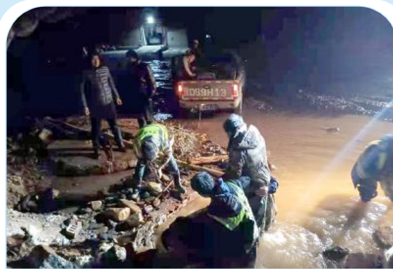
3月21日，市第三水厂直径1400毫米的输水主管网因道路施工被损坏，第一、二水厂虽全压供水，但市区高层及管网末梢部分区域供水仍将受到影响。当日深夜，自来水公司组织人员全力抢修。