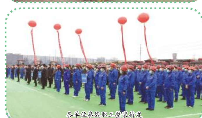
各单位参战职工整装待发