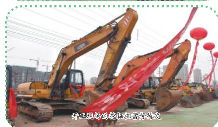
开工现场的挖掘机蓄势待发