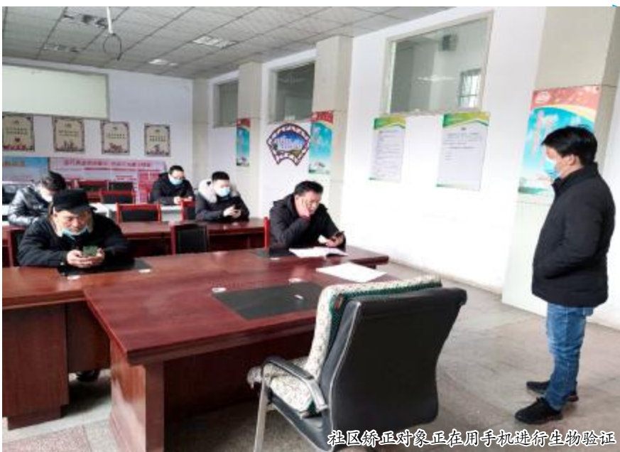
社区矫正对象正在用手机进行生物验证

本报讯（融媒体中心通讯员 杨伟伟）2月25日至26日，汝州市司法局社区矫正执法大队联合市检察院第三检察部，连续两天对我市部分司法所社区矫正对象进行现场信息化核查和警示教育。市检察院第三检察部主任王超阳、张志军等人参加了此次活动。