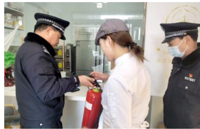
民警检查蛋糕店内消防设备

本报讯（融媒体中心记者 梁杨子 通讯员 张红阳）为深刻吸取山东禹城火灾事故教训，切实做好辖区消防安全工作，2月23日，汝州市公安局煤山派出所组织民警深入辖区蛋糕房开展消防安全检查。民警重点检查了辖区内蛋糕房是否落实消防安全责任制，消防设施设备是否保持完好有效，消防安全出口、通道是否畅通不被占用阻挡，电气线路、设备及供水等是否满足消防法规和技术标准的相关要求。针对检查过程中发现的火灾隐患，民警要求场所负责人立刻落实整改措施，并加强对员工的消防安全教育，紧绷安全之弦。