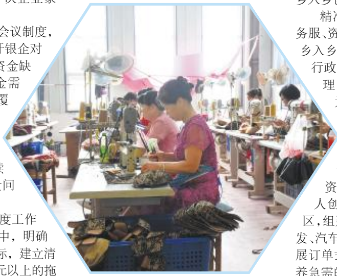
超强鞋业扶贫基地