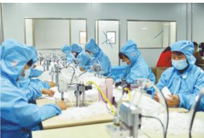
弘辉生物科技口罩生产车间