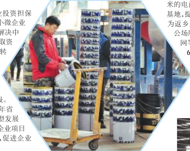
河南中鑫新型环保材料有限公司仿真石漆生产车间