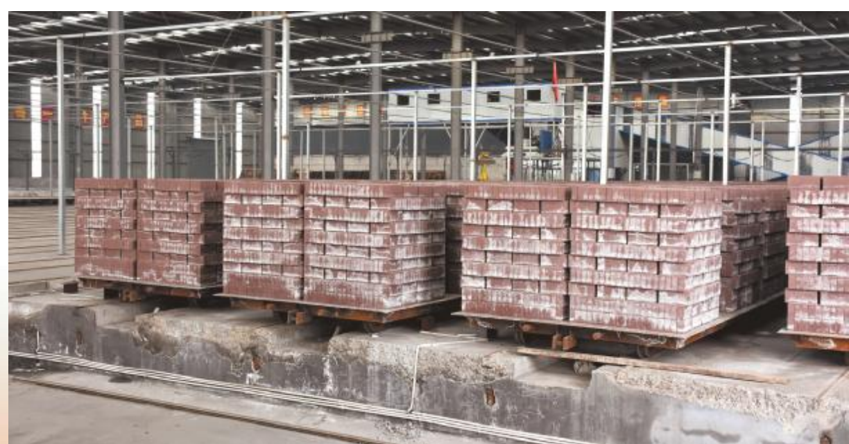
烽金源建材有限公司生产车间

筑巢引凤,引金凤。近年来,汝州市先后吸引3.8万名在外人员返乡发展,一大批能人回归,推动汝州高质量发展。2020年全市城镇新增就业12316人,新增农村转移劳动力6829人。2020年全年新增市场主体10762户,增幅34.2%。我市生产总值从2016年的398亿元增长到2020年的485.5亿元,财政收入从2016年的23亿元增长到2020年的35.3亿元,稳居河南省县级市前列,2019年、2020年成功入选全国县域经济百强县,2019年荣获全国营商环境百强县。