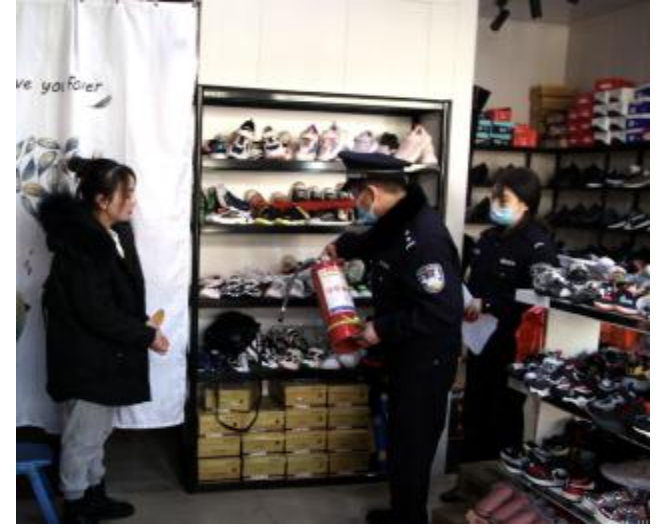
民警进行安全检查

本报讯（融媒体中心记者 梁杨子）为确保辖区群众过一个平安祥和的春节，汝南派出所按照汝州市公安局治安大队的工作安排，积极开展节前消防安全及危爆物品专项检查行动。