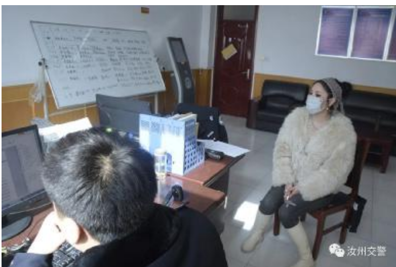
耿某在交警大队接受调查