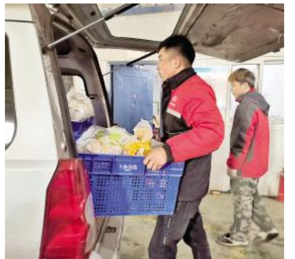
电商工作人员配货

本报讯 (融媒体中心记者 郭营战 通讯员 白志杰) 微信打开“小程序”,搜索“淘之味”,在页面上就可以看到“淘之味+”,点击打开页面,就可以看到汝州市知名电商企业河南淘之味电子商务有限公司开设的“网上年货节”,喜庆的页面、琳琅满目的商品让人顿觉浓浓的年味扑面而来。