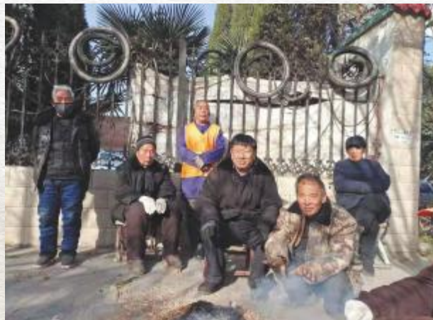
在临汝镇都寨村采访村中老人

桥底撬出来弄断的石碑)，翻开一看，上面还有落款“大清光绪”和两个“故儒”大字清晰显现，应是清代大户墓碑。可见这座石桥简直就是一部崆峒山的史书。