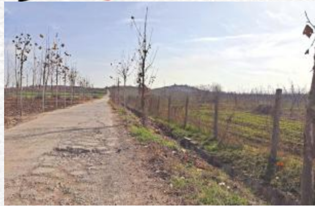
远眺崆峒山和相连的下鹤山

老汝州史料记载和民间传说，在汝州西部轩辕黄帝时期有广成泽，汉代皇家辟为狩猎演兵的广成苑，史界几乎人人皆知。此广成泽和广成苑均与崆峒山广成子有关，知者甚多。但汉唐时期，汝州有朝廷所设的广成关和广成驿，却知者甚少。而广成关和广成驿具体位置在哪里，恐怕知者更少，甚至至今还有一些文人学者在苦心探访。