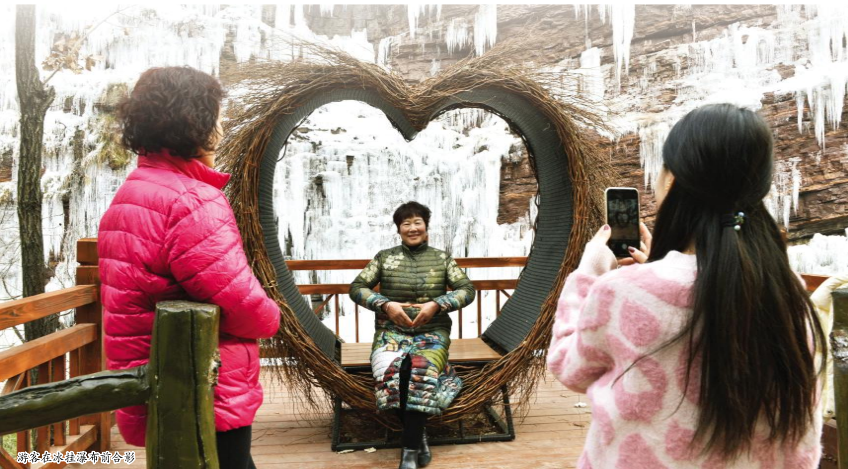
游客在冰挂瀑布前合影