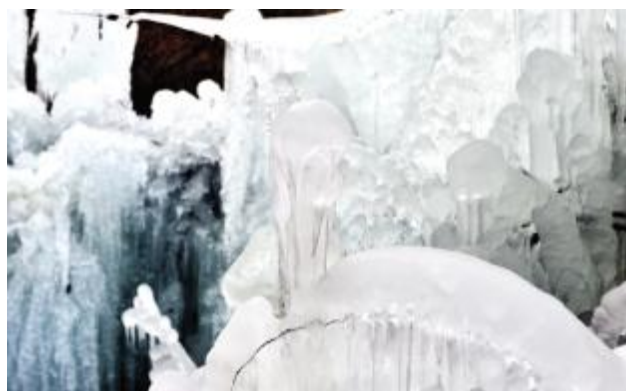
自然冰雕洁白如玉