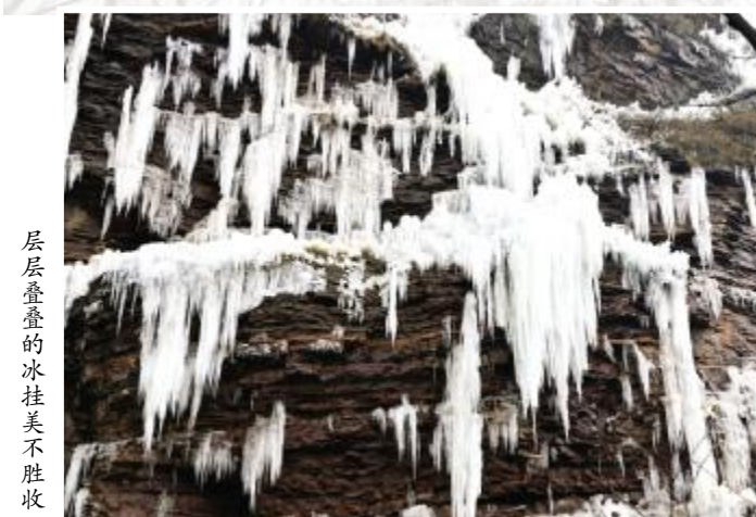
层层叠叠的冰挂美不胜收