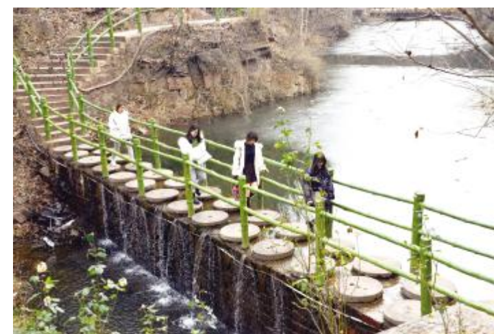
游人走过冰面小桥

大自然赐下如此瑰丽神奇的冰挂，可遇而不可求。九峰山情侣谷的冰挂已如约而至，和家人、朋友一起赴一场梦幻的“冰雪情缘”吧。温馨提醒，到九峰山赏冰挂时着装可鲜艳些，一袭红衣与冰挂更般配哦。