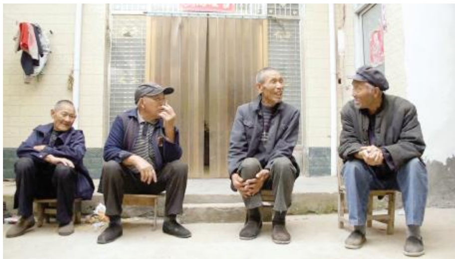
村中老人讲述石寨的故事