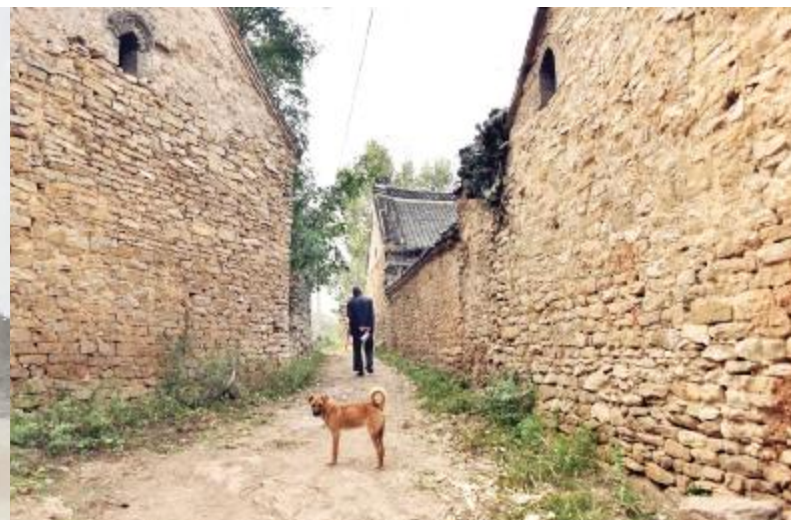
村民走过狭窄的巷道