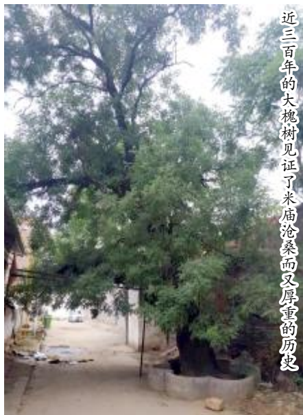
近三百年的大槐树见证了米庙沧桑而又厚重的历史

为御乱军危害乡民，玉皇山下的长马、安庄、米庙、李湾、李庄、水磨口和牛家湾等村的民众，以米庙为中心开始筑寨，共同防御匪患。但最终因各村居住分散、民众人数较少（解放前米庙村只有几十口人家），筑寨力量不足，建建停停，停建建，虽历时数年，一直到民国初期米庙寨周围土夯寨墙才初见雏形，寨门修建更无暇及，最终成了半拉子工程。到1958年，村民嫌夯土寨墙碍事遂将其扒毁，上世纪八十年代后彻底夷为平地。 据了解，米庙村从解放前的几十口人家，今天已发展到300余口，其最大特点是构成复杂，姓氏较多，主要姓氏有杨、安、魏、李、周、张、王、屈、罗、鲁、高、郎等姓。以前米庙院落规模较大，每月有六次集市（市），每年还有固定的大庙会，自然而然周边十里八里村庄，还有更远处的商贩来此做买卖，包括杨姓在内的十余个姓氏。这些来自四面八方不同姓氏的人，挣了不少银两后，在庙周围盖点小房子，一边做点小生意一边给大户人家种地，久而久之便以此为家并繁衍生息。后来，到此定居