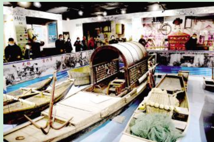
台湖镇文旺阁木作博物馆，十余个展厅把中国木作文化展示得淋漓尽致