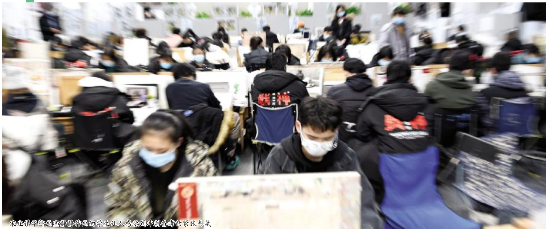
宋庄镇华翰画室静物画的学生让人感受到冲刺备考的紧张气氛