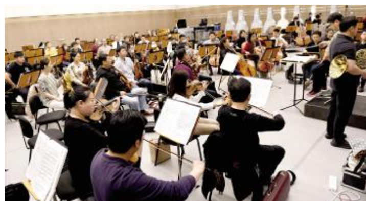
湖镇舞美艺术中心排练。国家大剧院的许多演出都在台

日前，中国新闻摄影学会八届三次理事会在北京通州召开。此次会议主要内容是学习贯彻党的十九届五中全会精神、举行“媒体融合助力脱贫攻坚”主题摄影高峰论坛、百家媒体聚焦通州摄影采访等系列活动。中国记协党组成员、书记处书记张百新，中国新闻摄影学会会长徐根根参加活动。