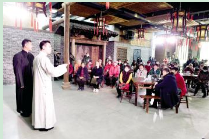
年轻的相声演员在充满艺术氛围的台湖茶馆里成长