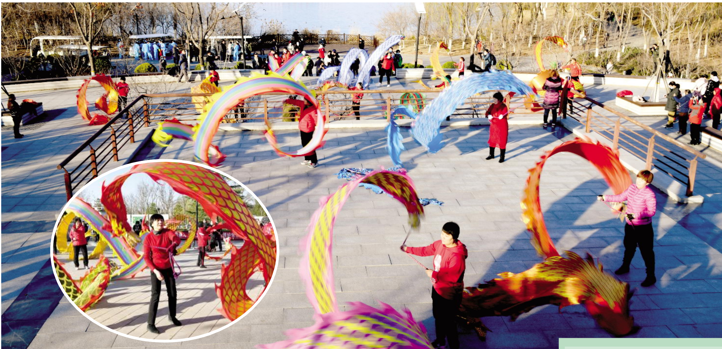
太湖公园大妈、大叔的健身舞充满表演范儿