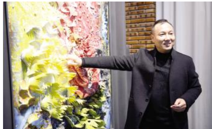
作的大型瓷板画创吉尼斯世界纪录。宋庄镇司秋利当代陶瓷艺术家，创