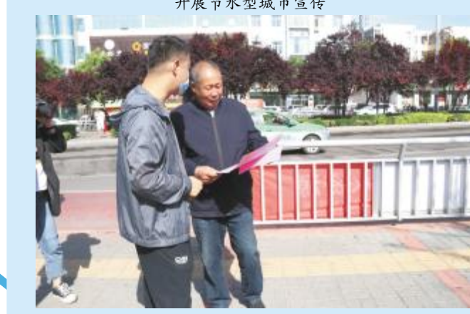
市民学习节水型城市知识