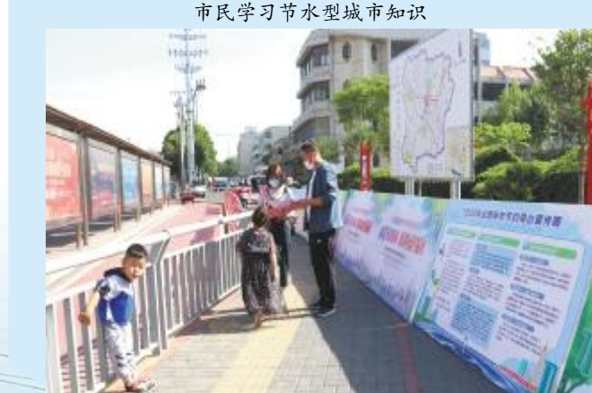
志愿者为市民讲解节水型城市知识