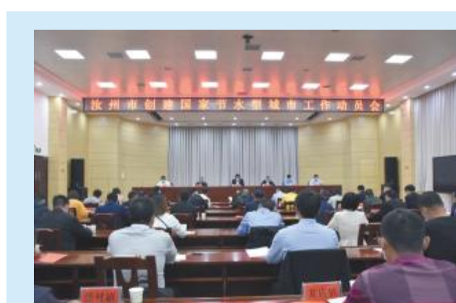
创建国家节水型城市工作动员会

我市多年来平均降水量为662.5毫米,水资源总量为2.761亿立方米,人均水资源量为386立方米,属极度缺水城市。缺水问题已成为制约经济社会高质量发展的瓶颈。 近年来,我市认真贯彻落实习近平总书记“节水优先、空间均衡、系统治理、两手发力”的治水思路,全面落实国家节水行动,按照国家节水型城市创建工作要求和河南省委、省政府提出的大力推进节水型城市创建工作号召,在2018年成功创建省级节水型城市的基础上,不歇脚、不停步,全市动员,全民行动,再次吹响了创建国家节水型城市号角,终于取得决定性胜利。 经过9月23日~25日的现场考核,11月26日,第十批拟命名国家节水型城市在住房和城乡建设部网站进行公示,汝州市榜上有名。 国家节水型城市是城市节约用水工作的最高荣誉称号。 创建国家节水型城市,改善水生态环境,是市委、市政府的重要工作部署。近年来,我市抢抓机遇、转变观念、创新思路、攻坚克难,奋力推动高质量发展,围绕创建国家生态园林城市和国家节水型城市目标,按照“政府推动、公众参与、对照标准、彰显特色、持续推进、全面提升”的创建思路,通过一系列行之有效的措施,城市管水、用水、节水水平和群众爱水、惜水、节水意识不断提高,城市水环境质量明显改善,实现了水资源的高效利用、节约和保护,高质量完成了国家节水型城市创建工作各项任务。 市财政每年投入资金,治理城市节水及水环境综合。依据《汝州市城乡总体规划(2015-2030)》,编制完成了《汝州市城市供水与节约用水专项规划(2015-2030)》和《汝州市海绵城市专项规划》,对我市节水工作和海绵城市建设进行了一系列顶层设计,节水创建,规划先行,做活节水大文章,扮靓水韵新汝州。 嵩岳之南,伏牛之北,正在唱响一曲以爱水、护水、节水为主旋律的大合唱。一座城市因水而充满灵性,因灵性而充满温情。如今的汝州,引水治水、湖河绕城,在水的滋养下,孕育出温润如春的品性和灵动多姿的风采。