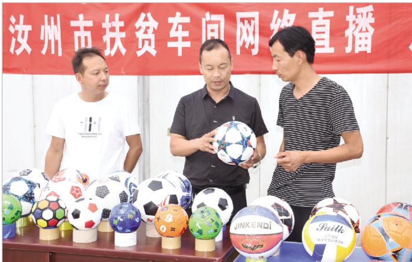
陵头镇叶寨村扶贫车间电商直播

这是一段鏖战贫困的时代凯歌,这是一幅乡村嬗变的美丽画卷,这是一张群众阅卷的民生答卷。