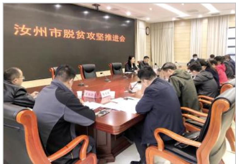
全市脱贫攻坚推进会

压实行业部门责任。成立了12个脱贫攻坚专项工作指挥部,分别由县处级领导任指挥长,全面压实教育、卫生、民政等行业部门责任,切实做好各项帮扶工作。建立专项指挥部半月会商机制,指挥长每月2次召集成员单位召开会商会议,分析研判解决工作中存在的问题。教育、卫生、医保、住建、水利等“两不愁三保障”相关行业部门,成立专项工作组,积极开展“清零达标”活动,逐户逐村逐户开展系统自查,建立问题台账,逐项整改落实。