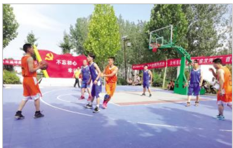
焦村镇邢村体育扶贫篮球赛