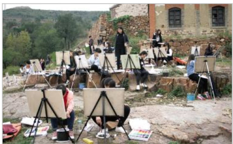
蟒川镇寺上村写生基地带动贫困户增收