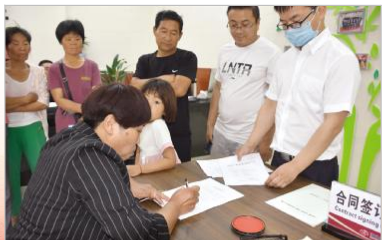
贫困户集中办理小额贷款

记录脱贫攻坚鏖战进程,弘扬脱贫攻坚时代精神,夺取全面小康伟大胜利。2020年是脱贫攻坚决战决胜之年,也是全面建成小康社会、实现第一个百年奋斗目标之年。不甘落后的120万汝州人民,在决胜全面建成小康社会、决战脱贫攻坚的过程中,充分发扬干事创业精神,用必胜的决心和踏实的作风,给出了一份让人满意的答卷。