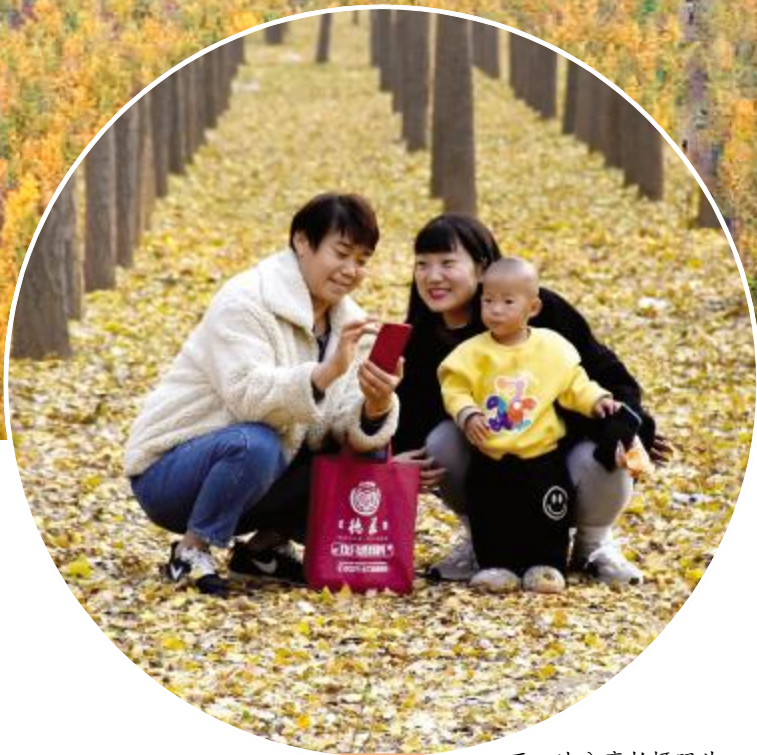
开心地分享拍摄照片