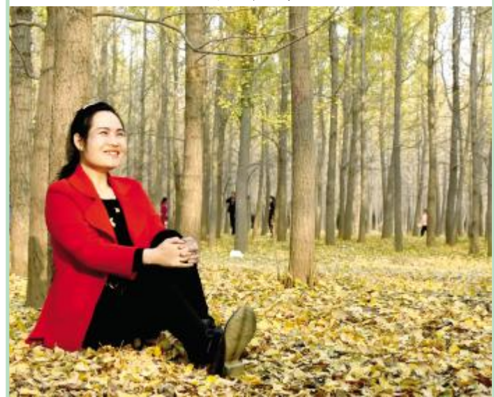
游人沉浸在银杏林里 美美相映