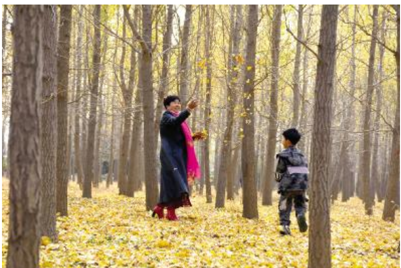
银杏林里的奶孙乐