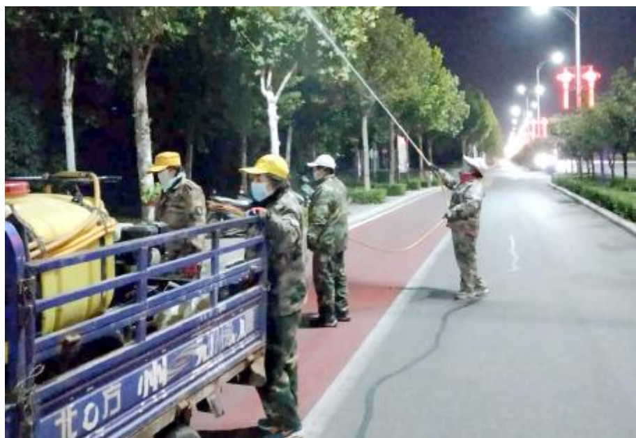
10月23日晚，市园林中心打药小组对朝阳路行道树喷洒药物，防治法桐方翅网蝽，减少方翅网蝽来年爆发基数。