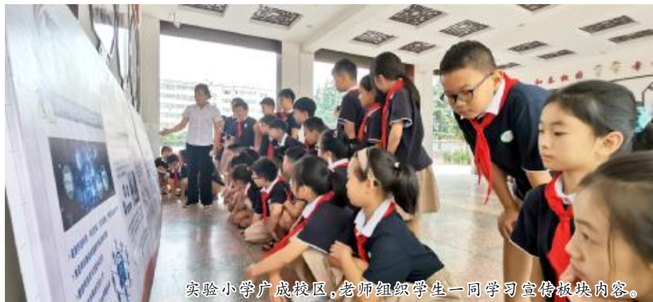
实验小学广成校区，老师组织学生一同学习宣传板内容。