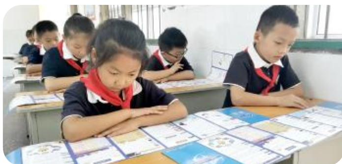
班会课上，学生们仔细阅读网络安全宣传手册。

本报讯（融媒体中心记者 陈晶）9月15日，市教体局组织全市各中小学开展网络安全宣传进校园活动。