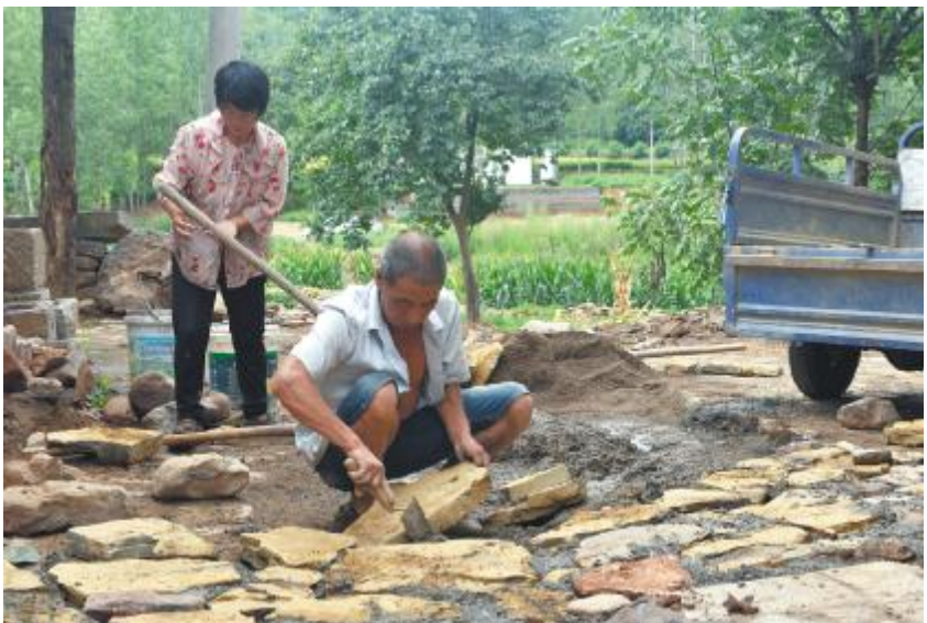
正在铺设的村中小道