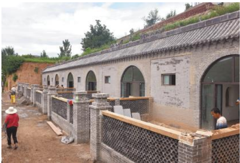
小院窑洞显现雏形