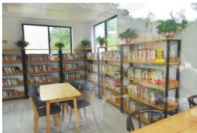
环境优美的图书馆