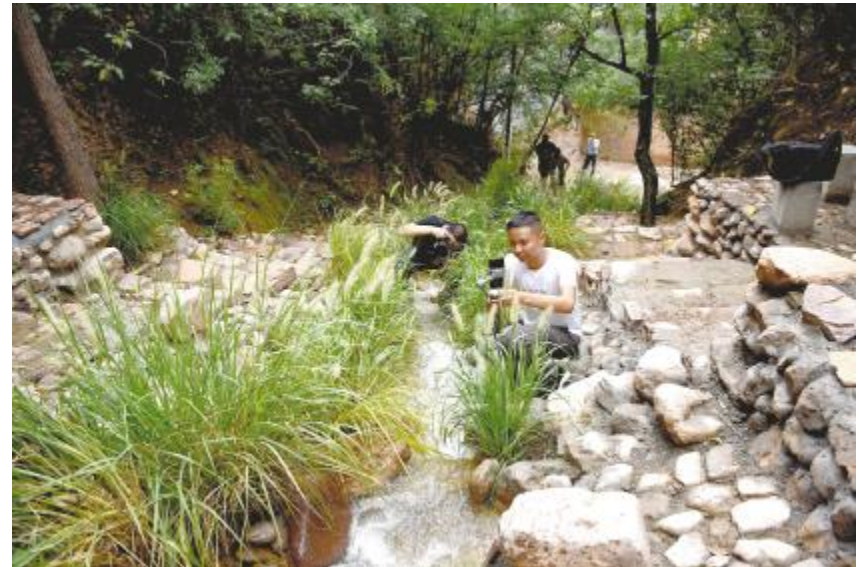
摄影爱好者在村内拍摄