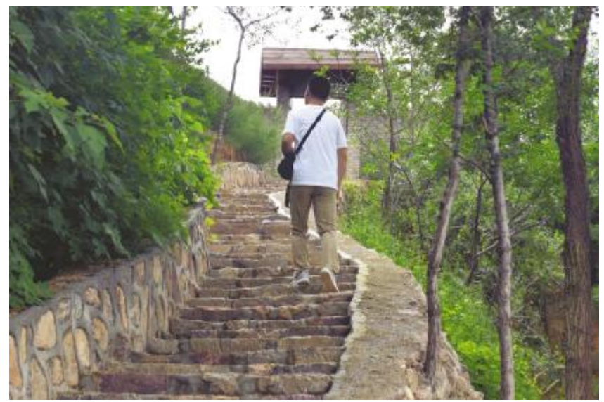
游人行走在村中石阶上