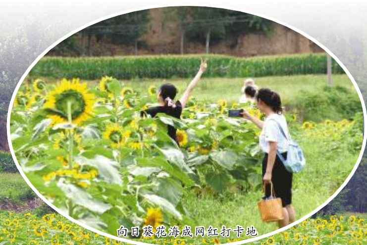
向日葵花海成网红打卡地