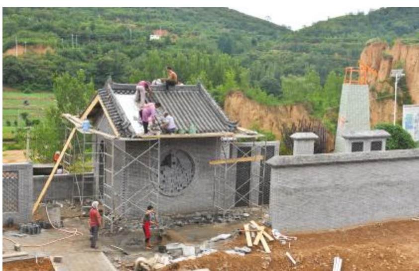
新建项目正在施工中