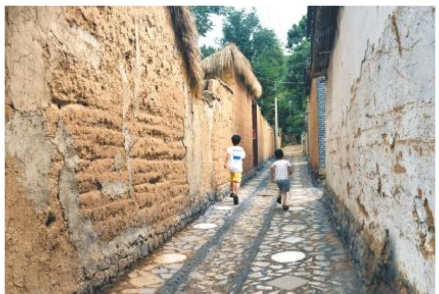
儿童在小巷中奔跑

景区目前已与国内知名旅游公司合作,对景区进行高标准整体提升,确保“十一”前景区投入运营。