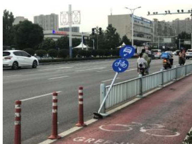
7月20日，笔者路过风穴中路时，看到一个交通标志牌倾斜幅度较大，而标志指示的机动车道上依旧有不遵守交通规则的市民骑电动车行驶。