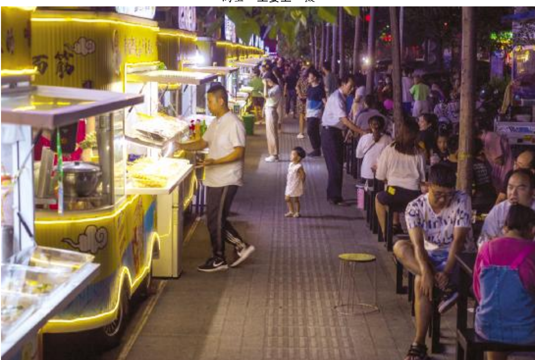
小食客 张锦娜 摄