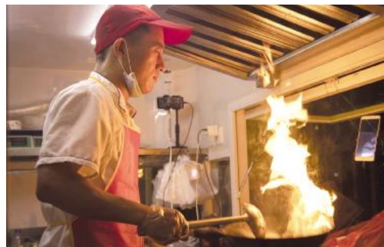
现场直播