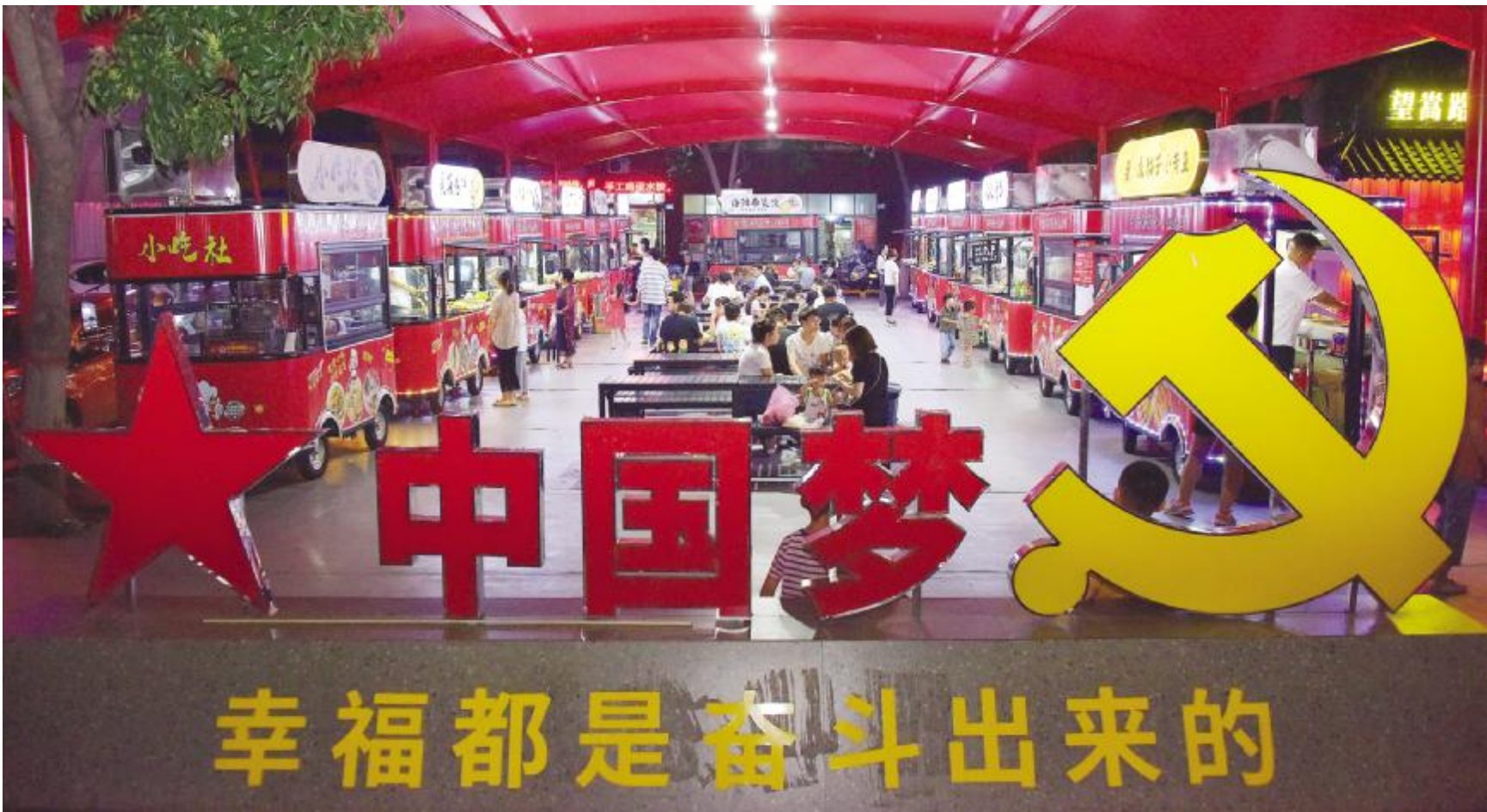
党建引领