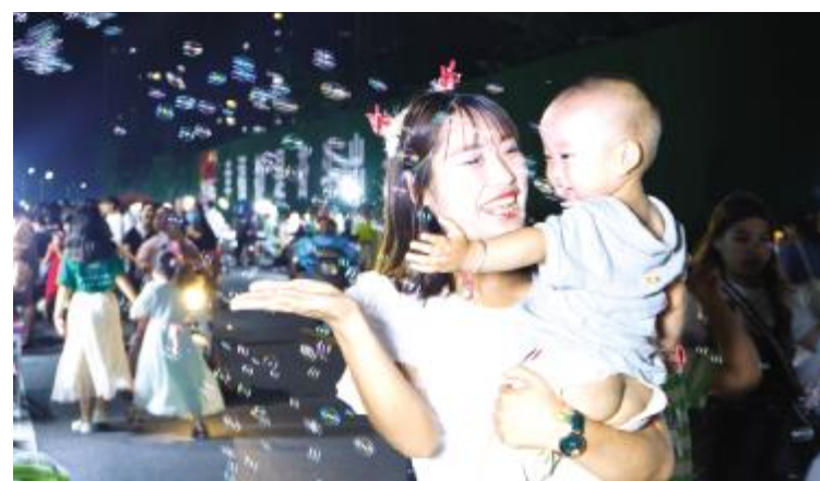
开心泡泡