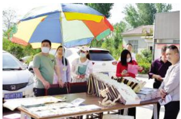
志愿者为马庙村捐助乡风文明读本

建立“1+2+10+N”的文明实践志愿服务队伍模式。市委书记担任总队长，带头开展文明实践活动；市委常委、宣传部长担任宣传教育志愿服务队伍大队长，把理论宣讲和思想政治工作放在首要位置。各乡镇街道党（工）委书记担任本辖区志愿服务队大队长，发挥表率示范作用。盘活人才资源，吸纳理论专家、乡贤人物、道德模范、“五老人员”“好媳妇”等3800多人，组建理论政策、文化艺术、卫生健康、助学支教、科技科普、法律服务、生态环保、孝善敬老、移风易俗、扶贫帮困等10支常备志愿服务队伍，围绕乡村振兴课题，根据群众需要，灵活机动、经常性开展各种活动，具有汝州特色的志愿服务团队活跃在群众身边。