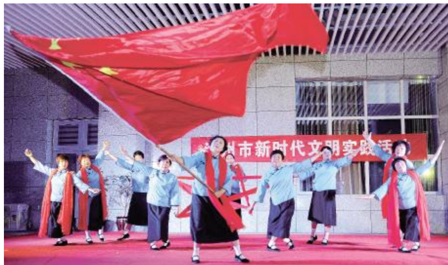
文艺志愿者惠民演出

随着新时代文明实践活动的深入开展，党员干部的干劲更足了，城乡面貌变化更大了，群众的满意度更高了。中心将进一步优化资源，巩固阵地，壮大队伍，以更加有力的举措将全市的新时代文明实践推向前进。