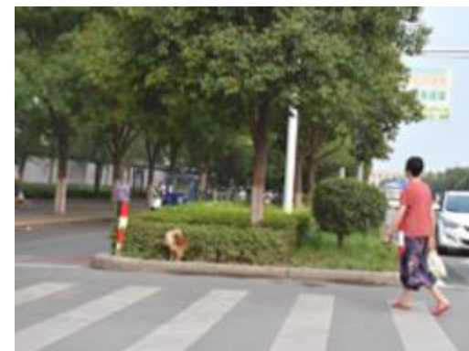
在朝阳西路,一位市民遛狗没有牵绳。