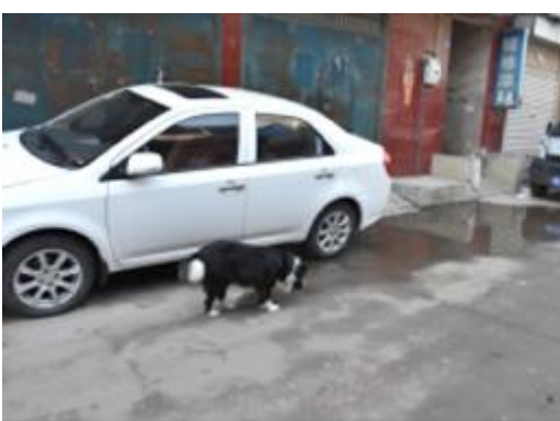
在青龙街,一只狗狗正在四处溜达,其周围没有主人的身影。