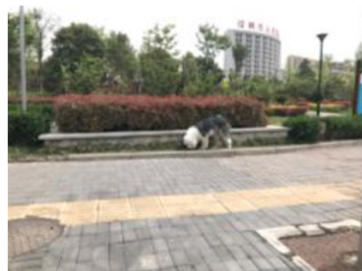
在双拥公园附近的人行道上,一只没有牵绳的狗狗正在四处溜达,其主人不见踪影。