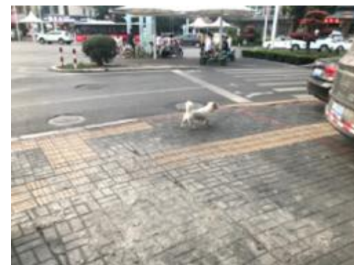
在广城路与城垣路交叉口,一只没有牵绳的狗正在溜达。