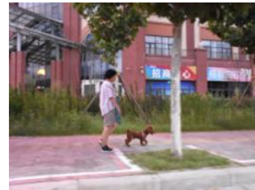
在万江城附近,市民遛狗没有牵绳。