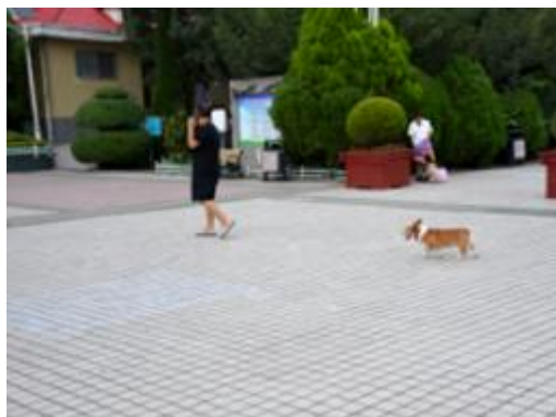
在丹阳公园内,市民遛狗没有牵绳。