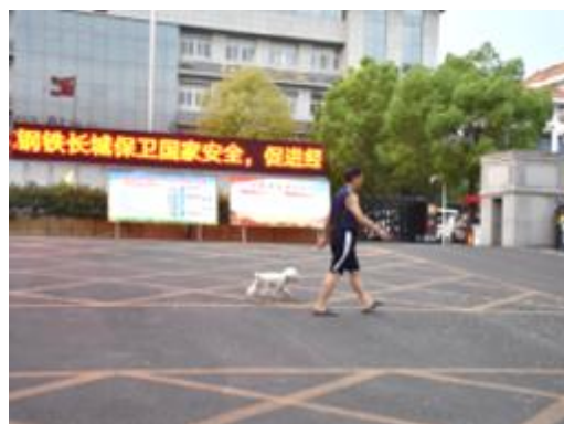
在广成东路,市民遛狗没有牵绳。