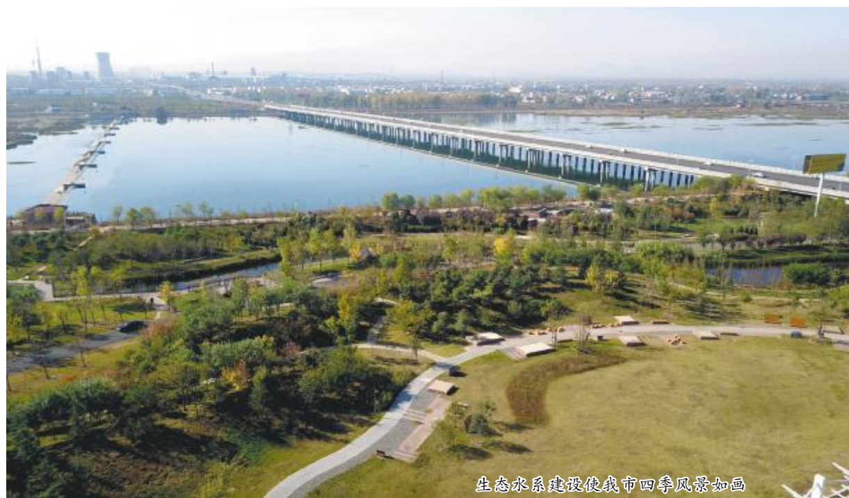
生态水系统建设使我市四季风景如画