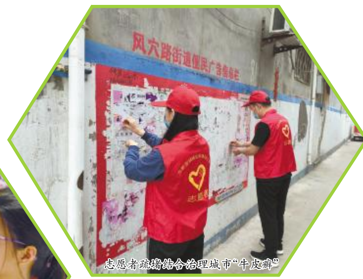
志愿者疏堵结合治理城市“牛皮癣”