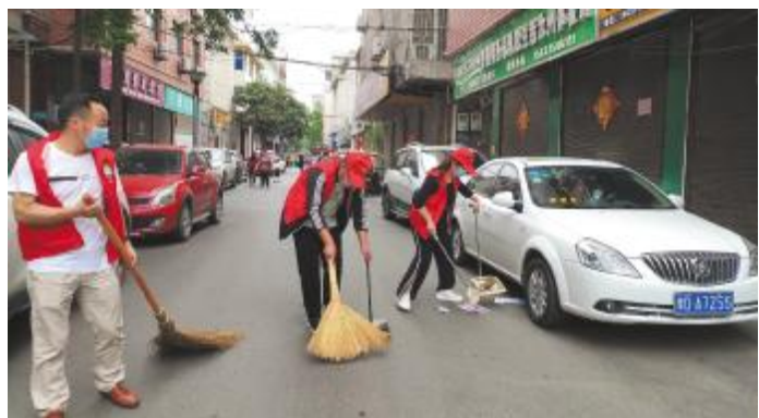
志愿者走进大街小巷开展环境秩序治理