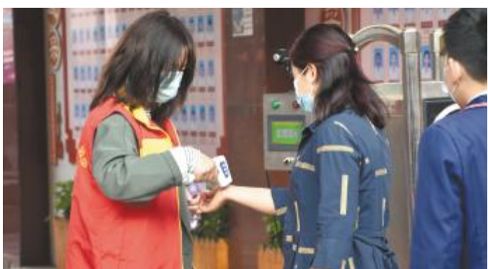
志愿者参与新冠肺炎疫情一线防控