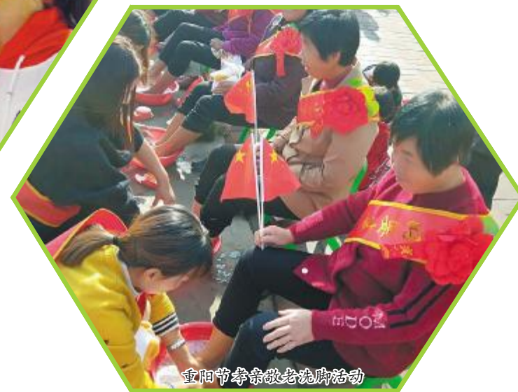
重阳节奉茶敬老慰问活动