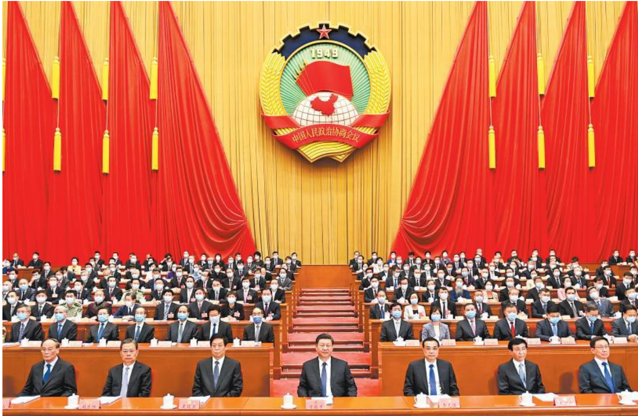
5月21日,中国人民政治协商会议第十三届全国委员会第三次会议在北京人民大会堂开幕。这是习近平、李克强、栗战书、王沪宁、赵乐际、韩正、王岐山在主席台就座。

汪洋总结了过去一年多来人民政协工作。他说,在以习近平同志为核心的党中央坚强领导下,政协全国委员会及其常务委员会以习近平新时代中国特色社会主义思想为指导,