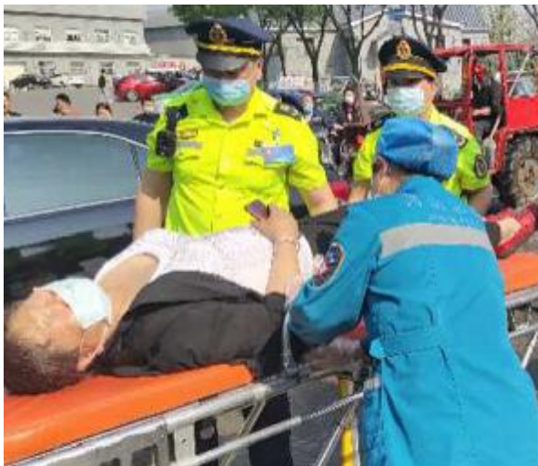
5月1日，在火车站与专业户街十字路口，一辆绿色越野车与一辆电动车相撞，电动车驾驶人被撞倒，现场混乱。正在火车站站点开展交通执法行动的市交通运输局执法局稽查大队五名执法人员见状迅速分工，帮助医护人员把伤者抬上救护车。