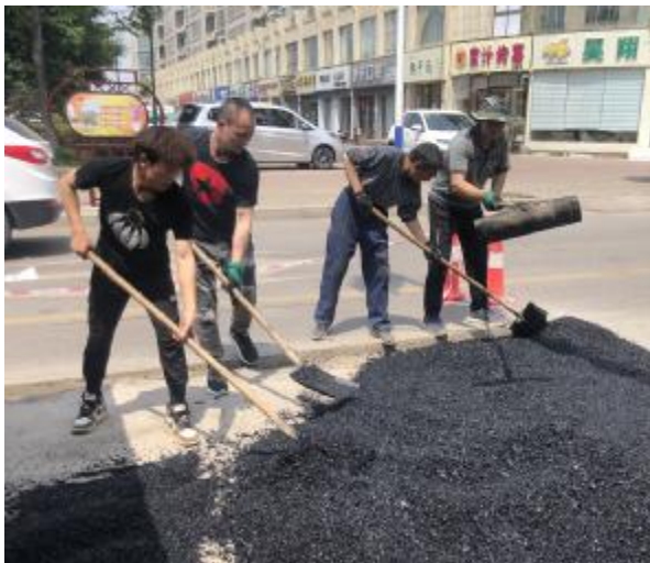
5月2日，笔者在朝阳路与锦绣路交叉口看到，工人们忍着刺鼻的气味、沥青颗粒上130℃高温的炙烤，迅速把沥青摊铺整齐，一名工作人员驾驶着压路机将这些摊铺好的沥青压得更加平整。