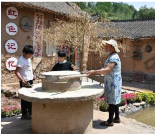
5月1日，笔者在陵头镇段于铺村王湾民俗旅游村看到，步行街上熙熙攘攘，游客众多，民俗文化体验项目火爆。图为小朋友在体验石磨劳动。