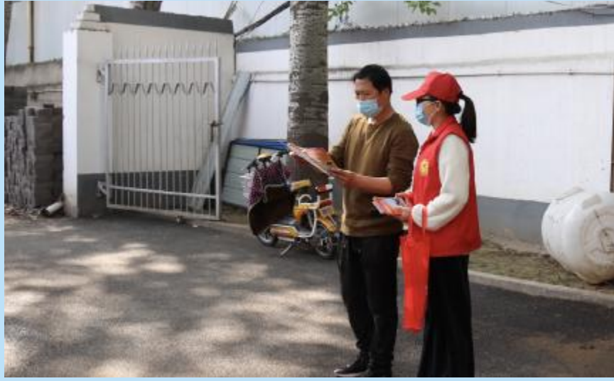
4月15日，市总工会走进市自来水公司开展全民国家安全教育日宣传教育活动，图为工作人员为职工发放宣传资料并讲解安全知识。