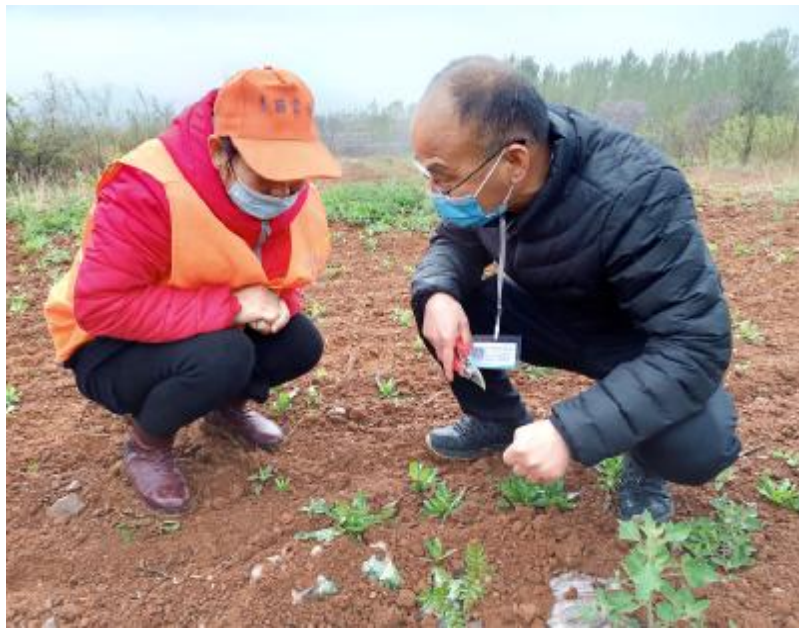
技术专家(右)为村民讲解花椒育苗知识

本报讯（融媒体中心记者 于俊鸽）“现在正值花椒育苗关键期，此时技术专家现场指导田间管理，对提高花椒成活率有很大的作用。”4月10日，市科协联合市畜牧局、林业局、农科所技术专家，到陵