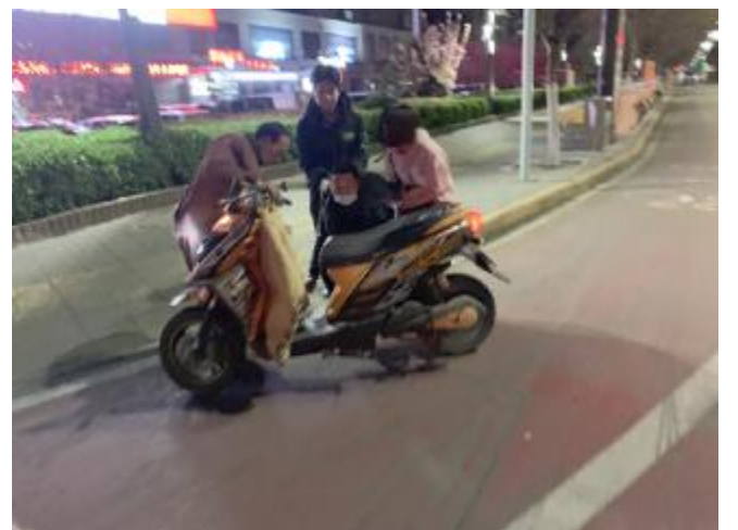
近日晚，在朝阳路与洗耳路交叉口，一名骑电动车的男子不小心摔倒在地，经过的行人立即上前，将其扶起。