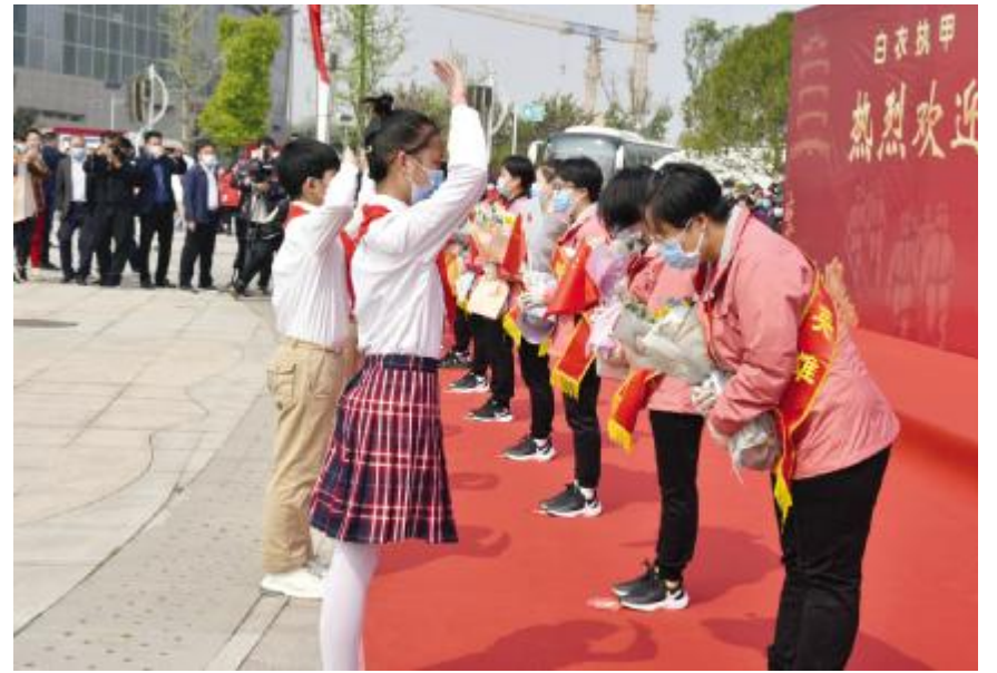
为援鄂英雄献花敬礼