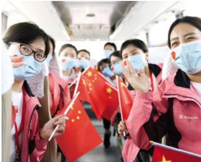
回家途中，队员们掩饰不住激动的心情