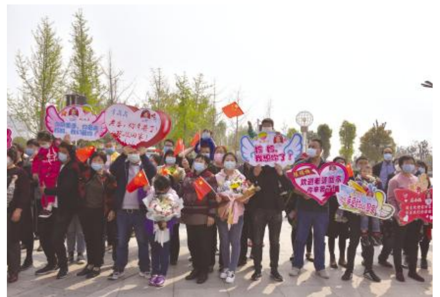
援鄂医疗队亲友团