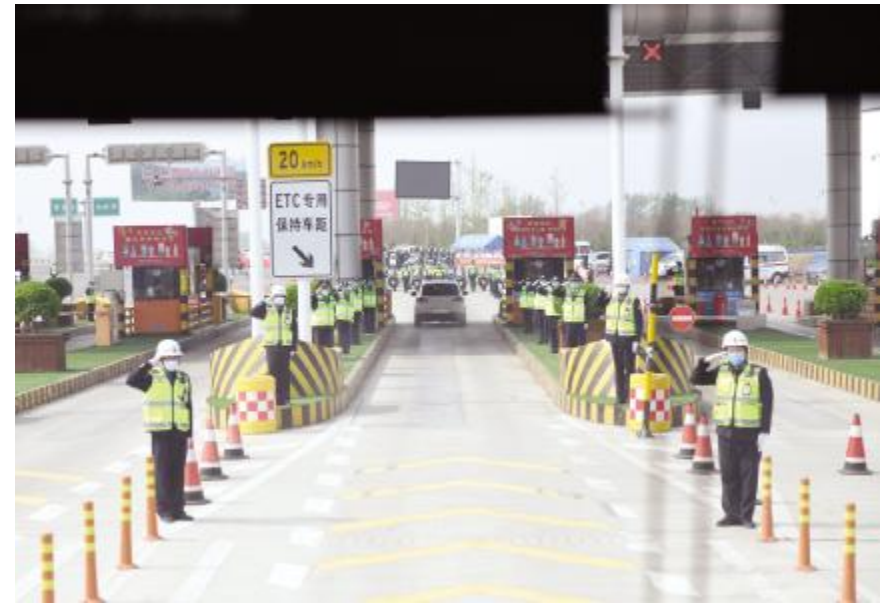
汝州东收费站为队员们安排了盛大的欢迎仪式