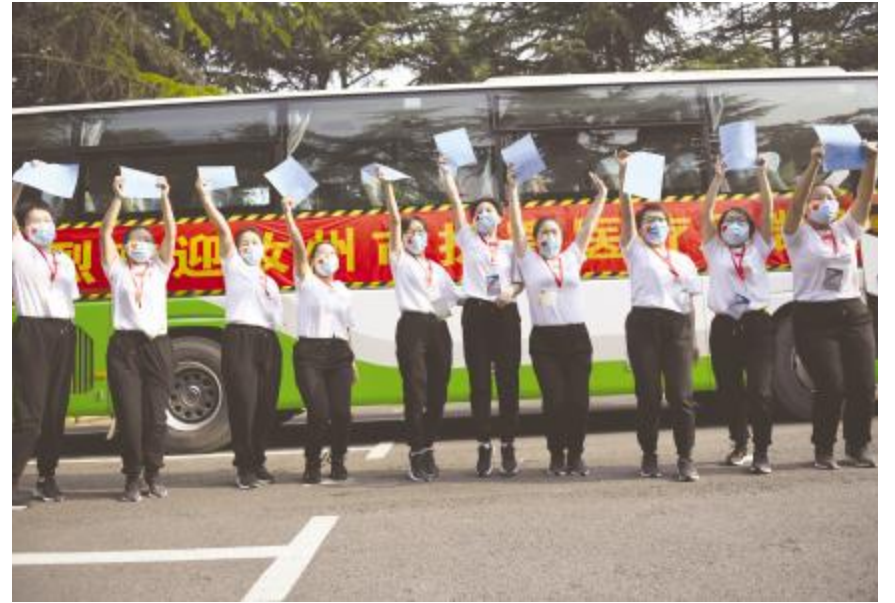
拿到解除医学观察通知书后，大家兴奋地跳起来