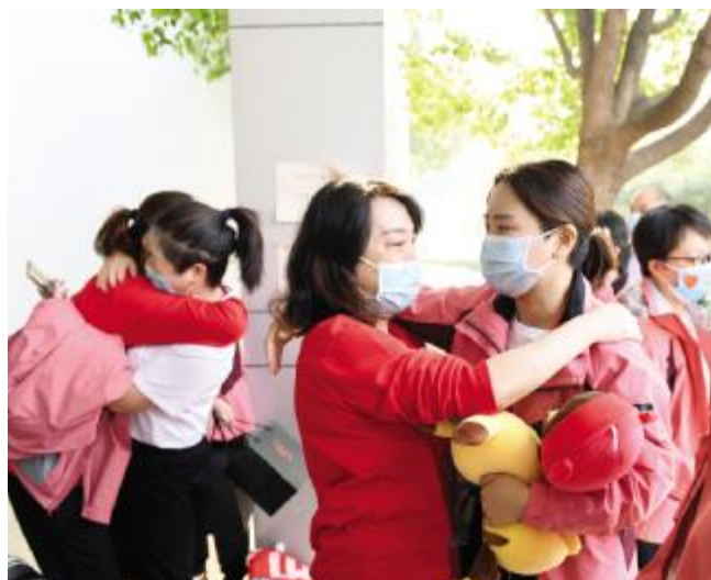
与平顶山援鄂医疗队领队告别

4月8日上午，汝州10名援鄂英雄在结束14天的休养隔离后，平安归来，载誉回家。汝州社会各界在市文化体育中心举行隆重的欢迎仪式，向胜利完成使命的英雄致以崇高的敬意。