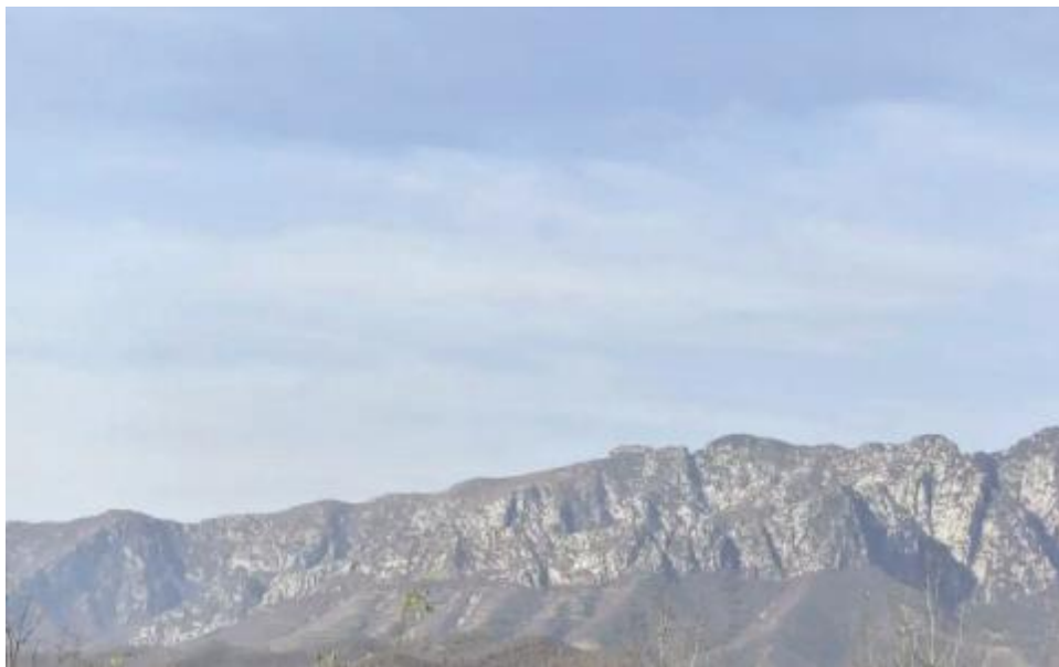
百姓口中流传千年的大峪镇女娲山

今年11月7日，由中国民协副主席、河南省民协主席程建军，中国民协顾问、河南省民协名誉主席夏槐群，中国民协党组成员、副秘书长吕军，华东师范大学民俗学研究所教授、中国民间文学大系出版工程民间文学理论专家组副组长田兆元，中国社科院民族文学所研究员、中国民间文学大系出版工程神话专家组成员黄中祥，中国社科院民族文学研究所研究员毛巧晖，中国民协理论处副处长孔宏图一行8人组成的专家