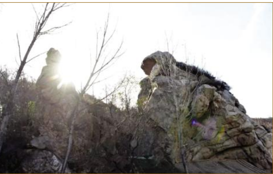
伏羲女娲“滚石成婚”自然景观

有诗为证： 娲皇大爱古荒愚，猛兽凶禽心胆寒。 抟土造人兴地盛，炼石治水补天穿。 教织渔网捞沧海，亲制竹笙响宇寰。 华夏文明多璀璨，丰功始祖后人传。