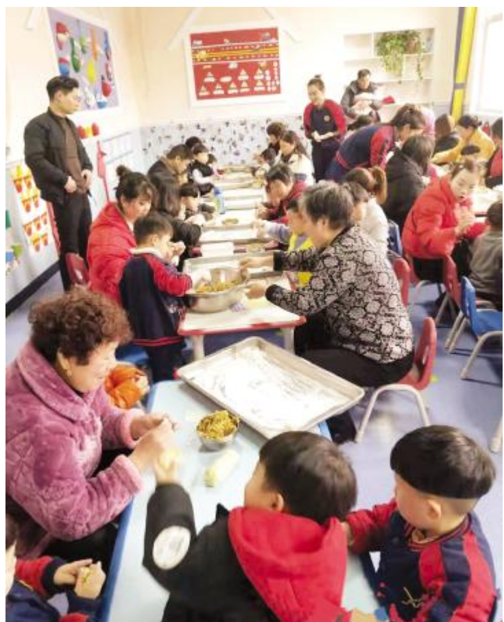
12月20日，汝州市童心幼儿园举办情暖冬至包饺子活动，家长和孩子们一起动手包饺子，体验传统节日的氛围和乐趣。