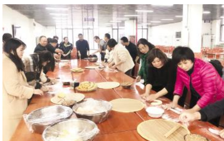
12月20日上午，市住建局举行“情暖冬至包饺子”活动。大家用自己拿手的方式包着高颜值的五彩水饺，现场气氛和谐，到处洋溢着“家”的味道、“家”的温馨。通过此次活...