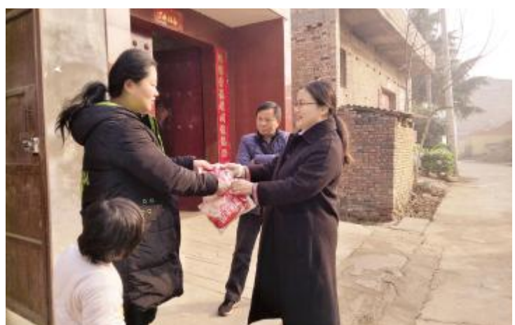
12月22日，市中医院医务人员带着饺子等慰问品来到钟楼街进程楼村，将浓浓的心意和祝福送到每一位贫困群众的心中，让贫困户感受到市中医院的一片爱心和帮助脱贫的决心。