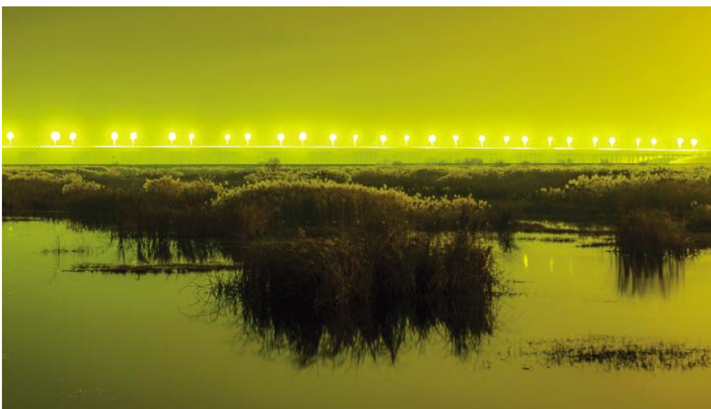
流光溢彩的北汝河湿地