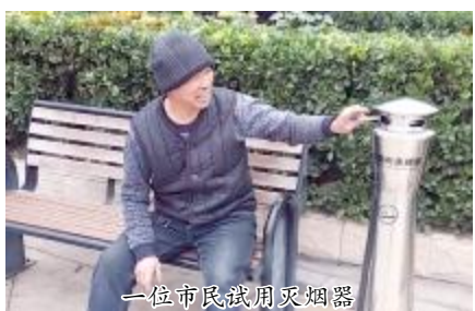
一位市民试用灭烟器

日,局环卫处工作人员就在路边游园等不影响公众的位置装上了新式灭烟器,力争把这件“乱丢烟头”的小事发生率降到最低。