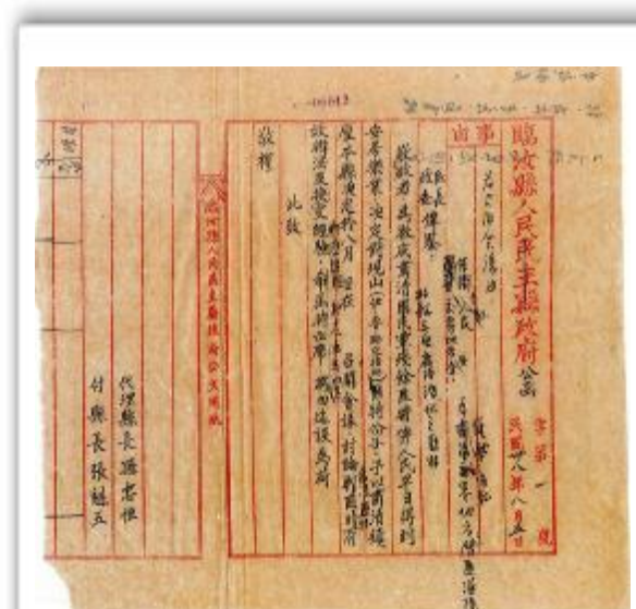
临汝县人民政府于民国三十八年八月五日召开会议为由发出的公函。内容提要为：为彻底肃清匪特，使人民早日得到安居乐业，决定召开会议，讨论肃清匪特有效办法及交换经验。 此函现存汝州市档案馆