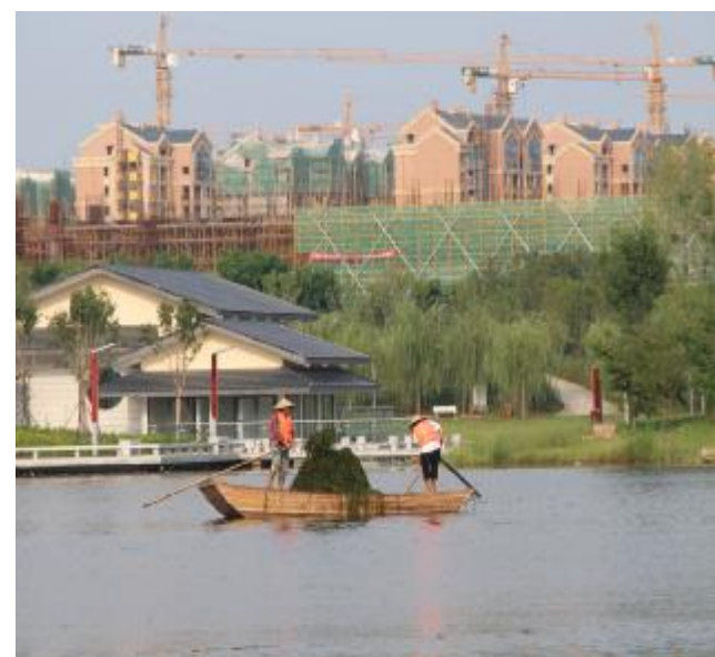
因夏季温度高，水草大量生长，为维护河道环境，近日，云禅湖上有三四位清洁工划船清理湖内水草。