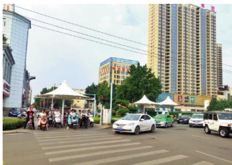
早上7点30分,上班人群在市标环岛等待绿灯。