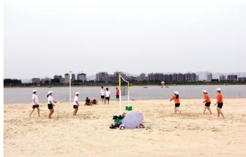
下午6点,汝河沙滩公园,几名市民自发组队打沙滩排球。