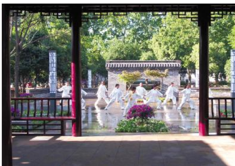
早上6点,市民们在煤山公园晨练。