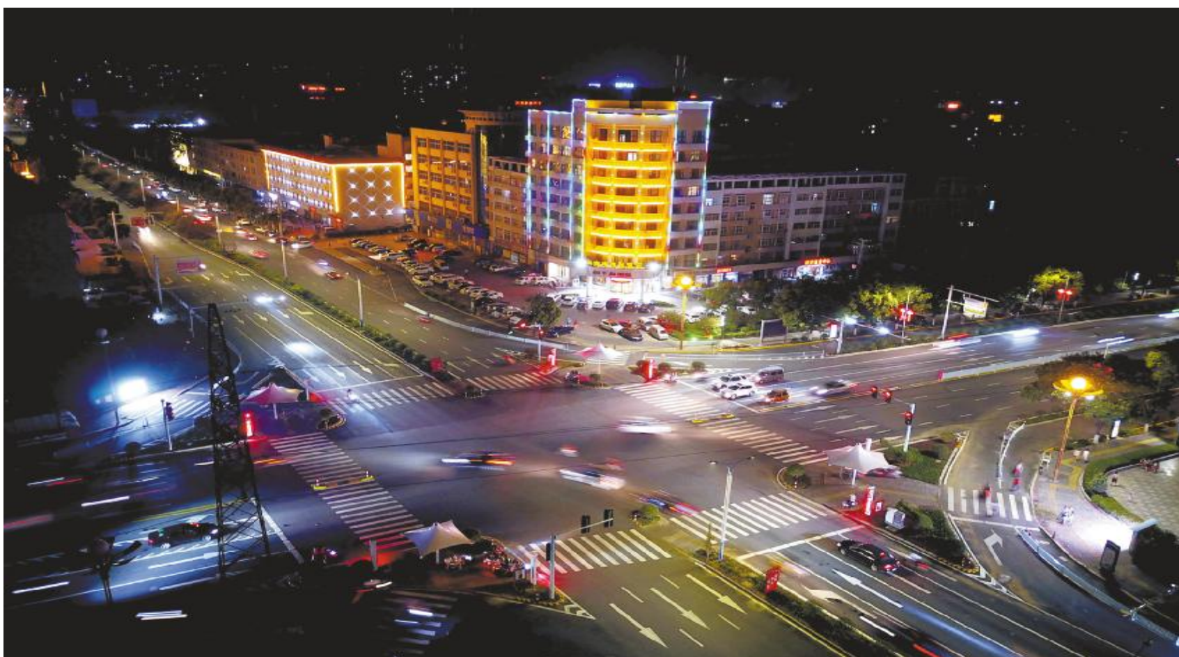
晚上12点,朝阳路风穴路口,璀璨灯光点亮汝州城。