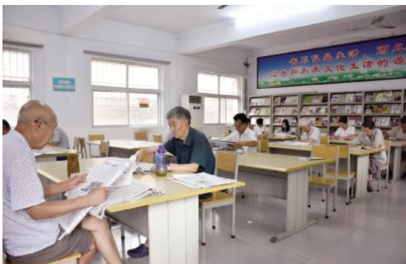
上午9点,市民在市图书馆阅览室阅读报刊。