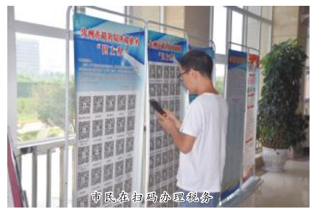
市民在扫码办理税务

本报讯(融媒体中心记者 陈晶)近日,市民之家联合税务局全力推行“最多跑一次”“自助办税”“自助办税”等便民办税举措,进一步方便办税群众,同时在办税大厅放置了信息采集、税务认定、申报纳税等285项办税事项的二维码,安排工作人员专门辅导办税群众自主扫码办业务,进一步提高行政审批效能,方便群众办事。