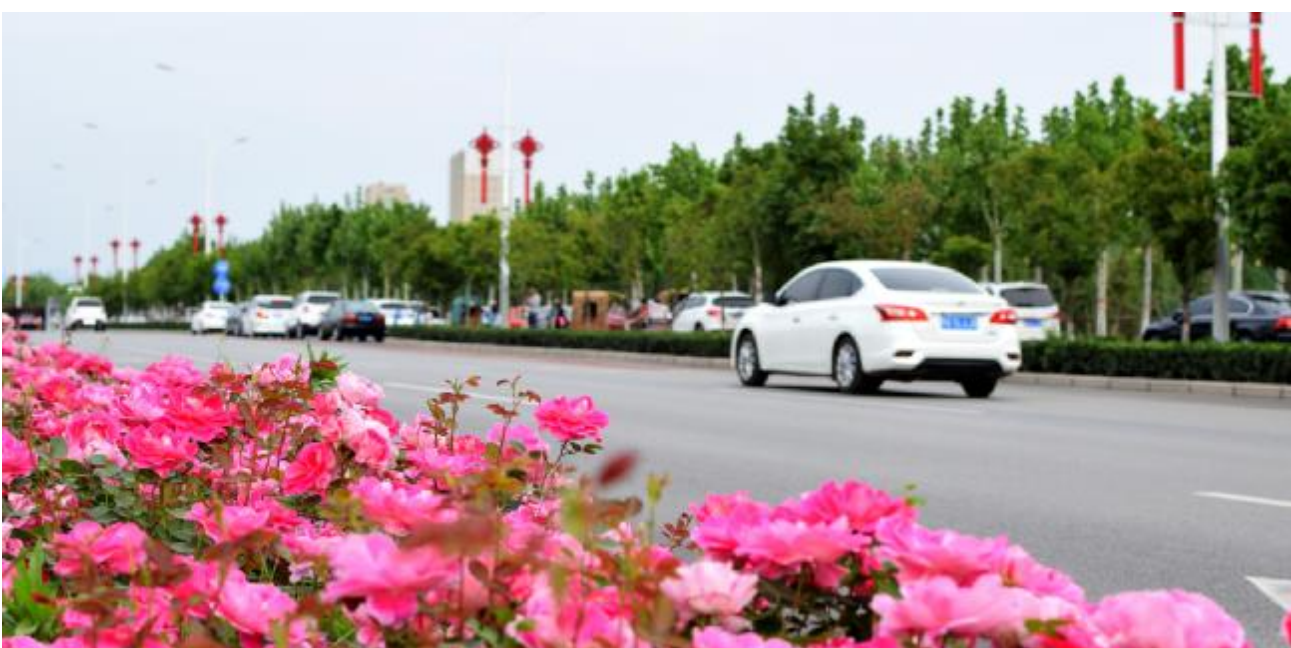
一路繁花 专业组