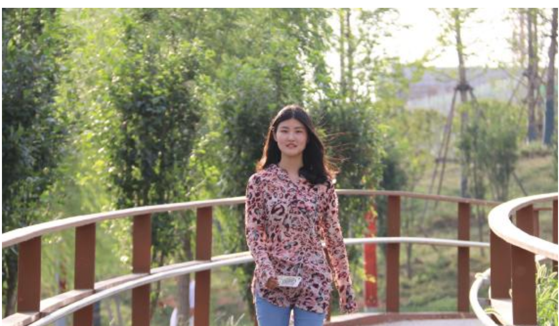
沐浴阳光 业余组