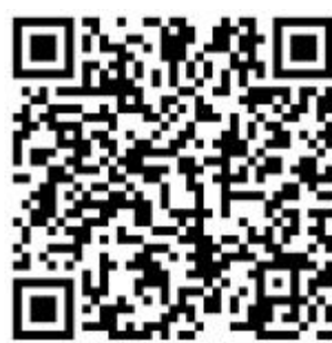
扫一扫,了解更多详情