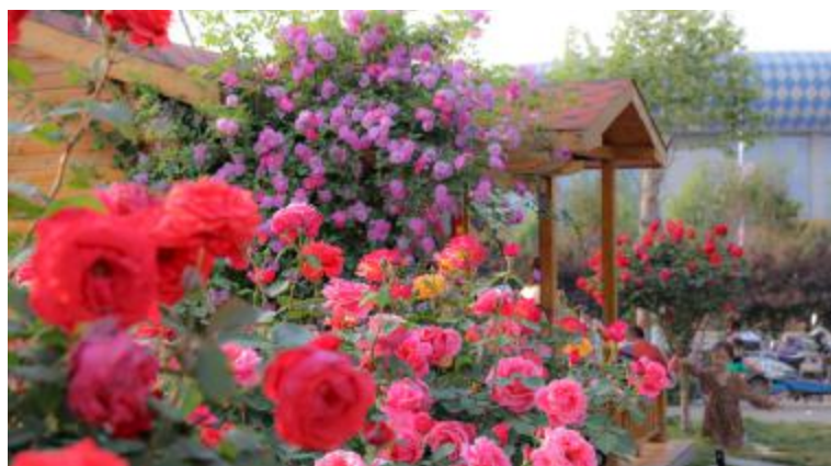
月季园 业余组