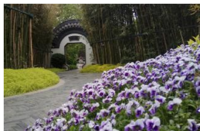
龙山大道一景 业余组