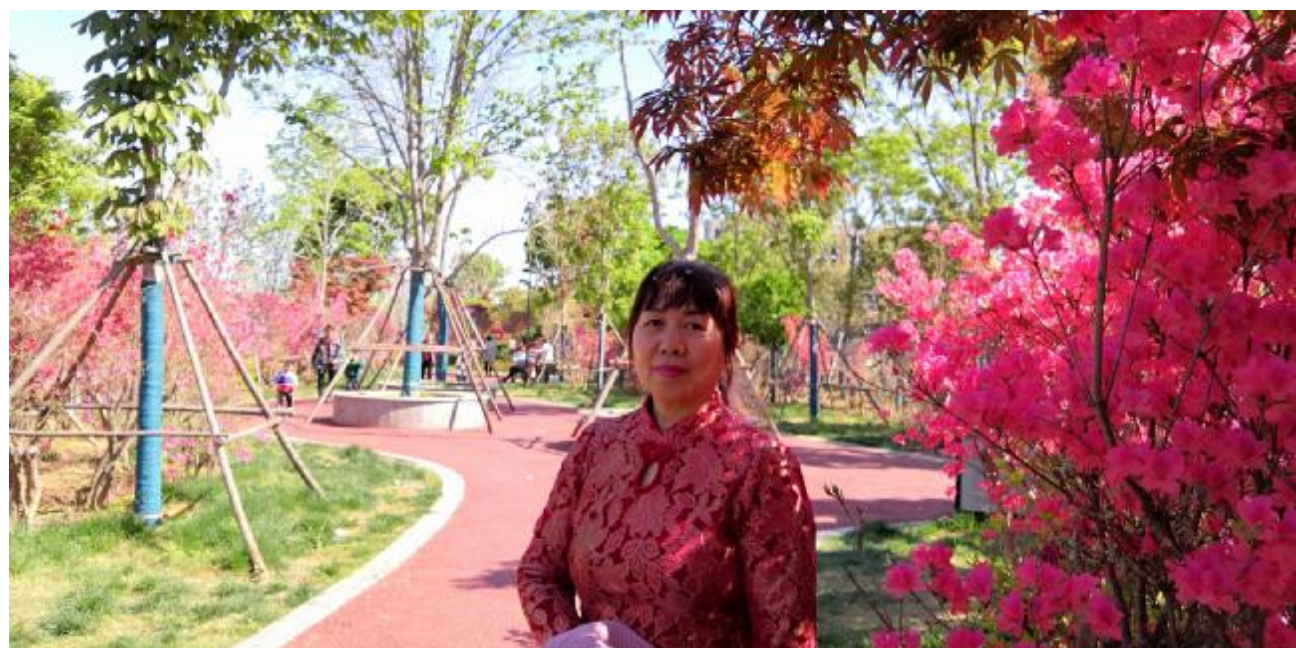
杜鹃花开 业余组