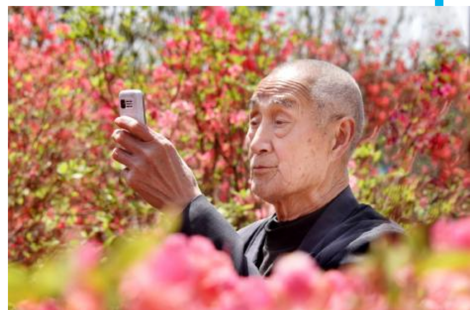
杜鹃园内的老人 专业组