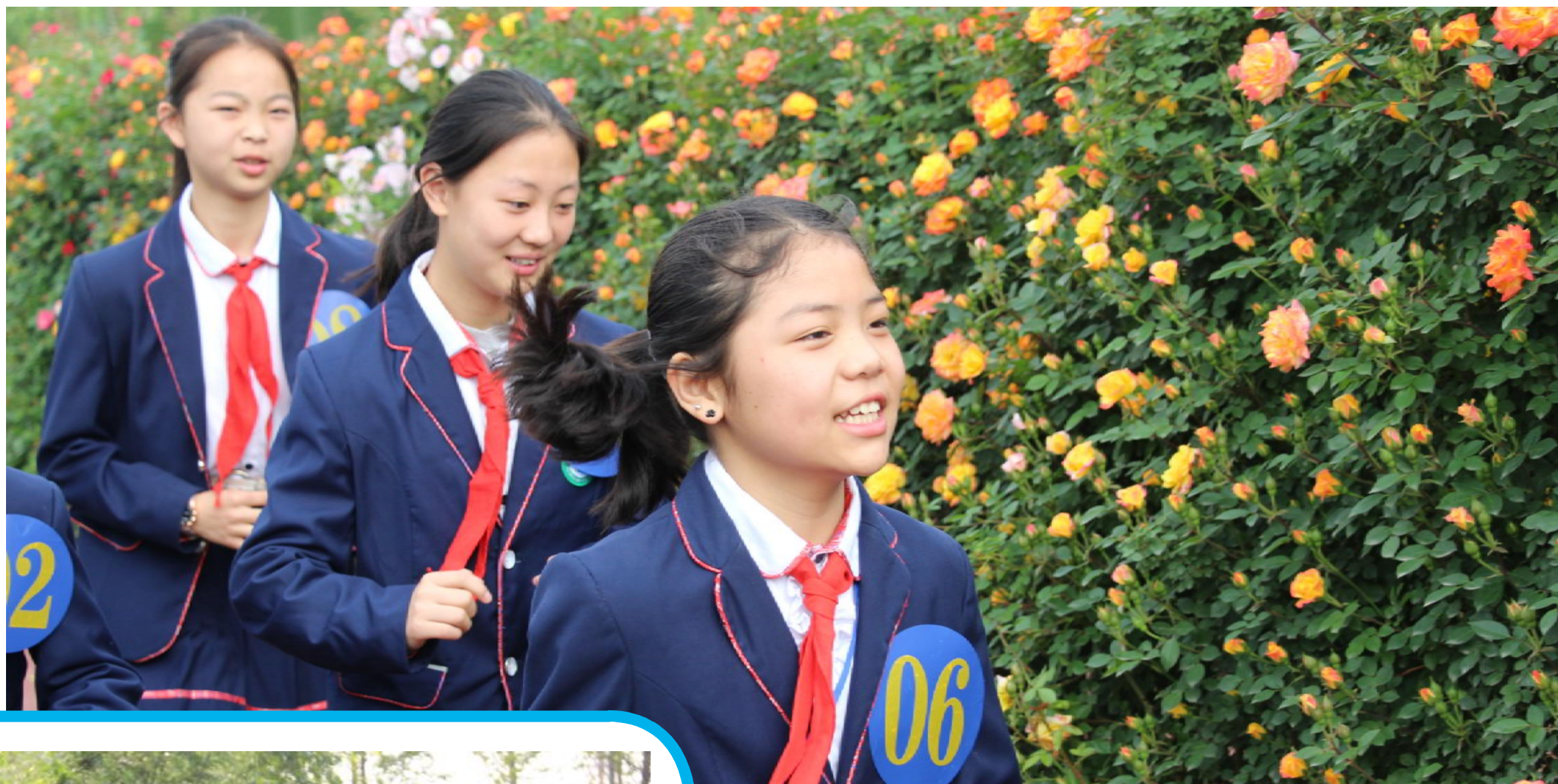
月季迷宫内的学生 专业组