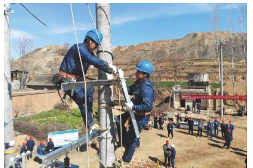
爬上线杆检修线路